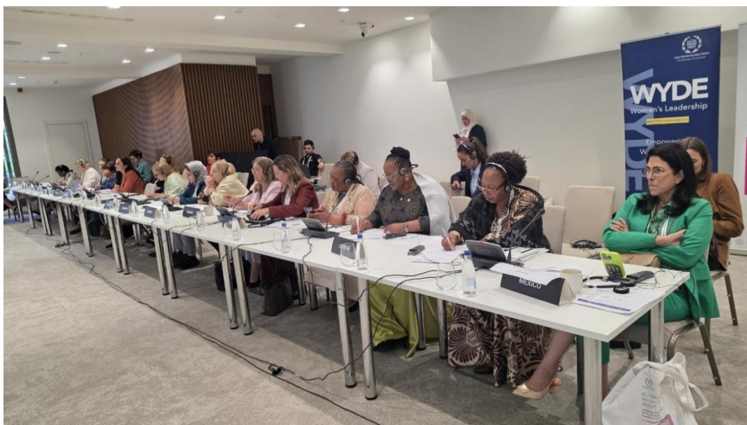
Foto en la reunión de trabajo del grupo 3.

En esta ocasión participé en el grupo 3, el cual revisó el tema “Lucha contra el sexismo, el acoso y la violencia contra las mujeres en el parlamento”.