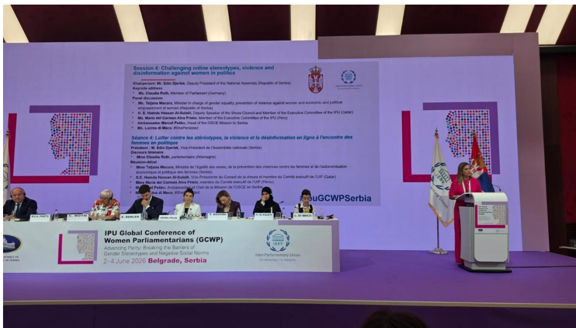
Sesión 4: ponencia como invitada especial.

La Conferencia concluyó con la adopción de un documento final presentado por Ivana Stamatović, diputada serbia y miembro de la Mesa de Jóvenes Parlamentarios de la UIP. El documento expone recomendaciones clave para promover parlamentos con perspectiva de género y fortalecer la cooperación entre parlamentos, la sociedad civil y las organizaciones internacionales, entre las cuales resaltan las siguientes conclusiones: