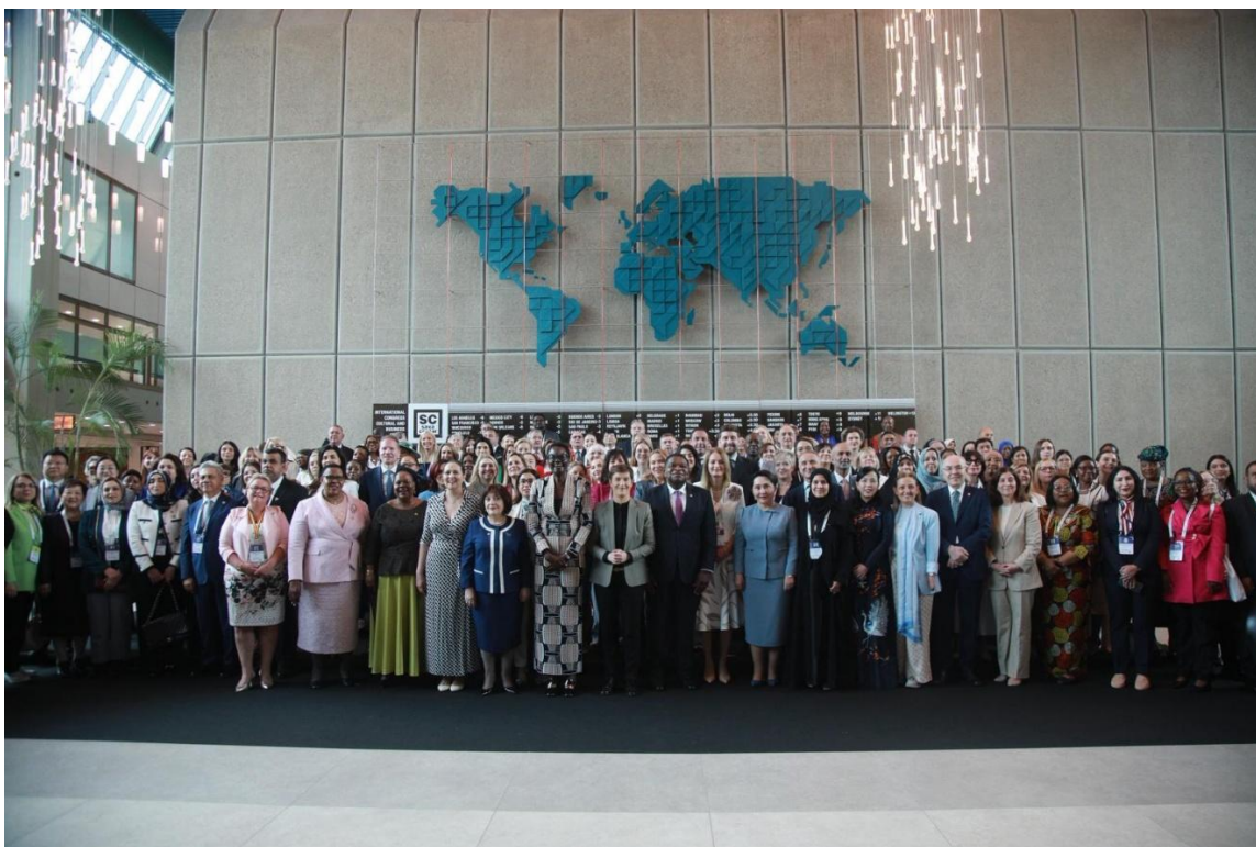
Foto oficial de la Conferencia Internacional de Mujeres Parlamentarias 2026

Es cuanto podemos informar para los fines pertinentes, por cuanto suscribo el presente documento.