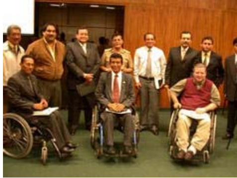
En la ceremonia estuvieron presentes los organizadores del evento

Cabe señalar, que APRODDI está afiliada a la Fundación para el Desarrollo Solidario -FUNDADES- y tiene como finalidad ejecutar proyectos destinados a fomentar el deporte entre las personas con discapacidad a nivel local e internacional.