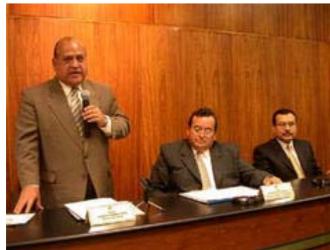
Ministro Sanabria felicitó realización de "II Juegos Nacionales Paradeportivos Perú 2003"

El titular del sector, resaltó el desarrollo de dichos eventos, ya que permiten aunar esfuerzos para lograr los objetivos de paz y desarrollo que tanto necesita nuestro país.