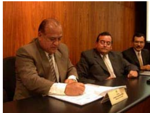
Ministro Sanabria firma convenio de cooperación interinstitucional con APRODDI

De esta manera se viene dando cumplimiento a los objetivos trazados por la presente gestión, que se ha planteado como prioridad, promover actividades que fomenten el sano esparcimiento dentro de nuestra sociedad.