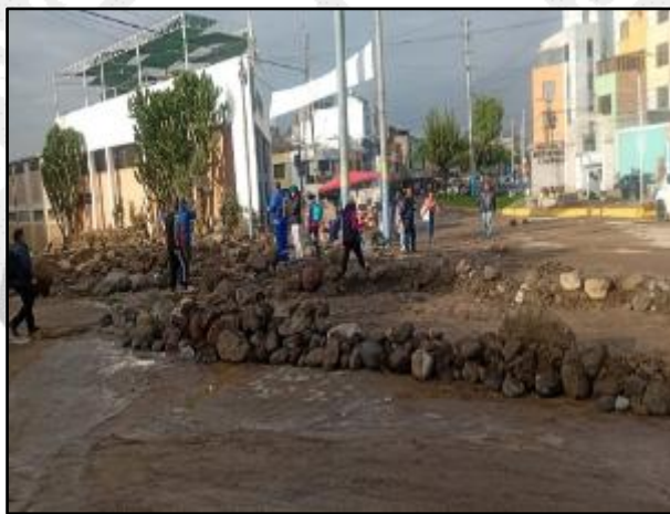
Huaco en el distrito de Sachaca