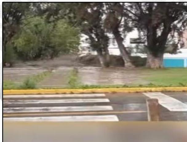
Lluvias intensas en el distrito de Arequipa