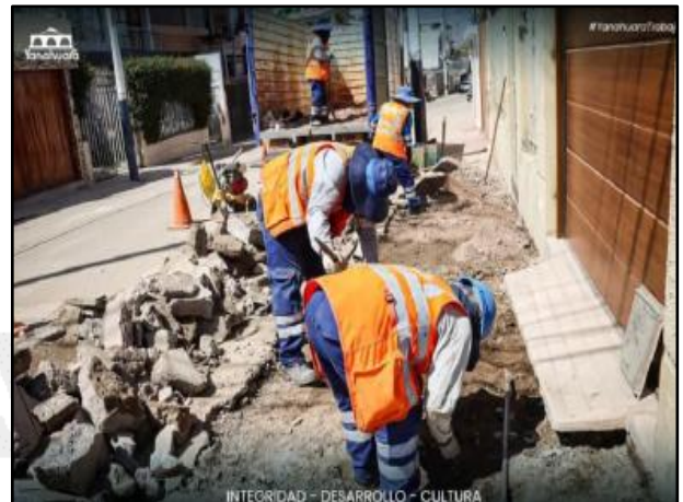
Limpeza de quebrada y rehabilitación de vías