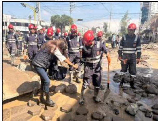
Lluvias intensas en el distrito de Yanahuara