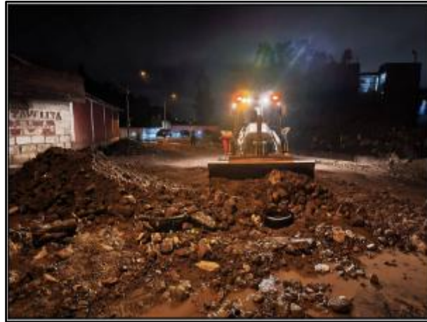
Vías afectadas en el distrito de Paucarpata