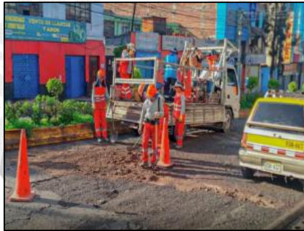
Trabajos de limpieza y mantenimiento de vías en la provincia de Arequipa