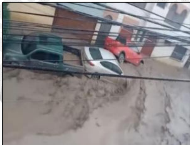
Huaino en el distrito de Yanahuara