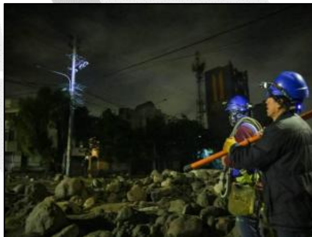
SEAL realiza trabajos para el restablecimiento del servicio de energía eléctrica