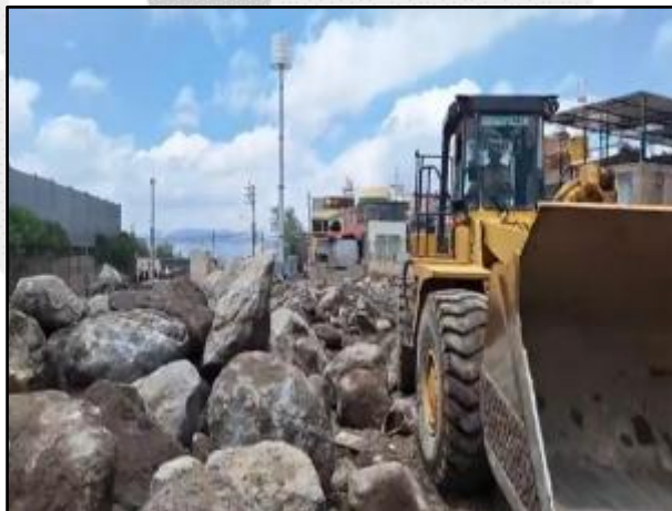
Huaco en el distrito de Cerro Colorado