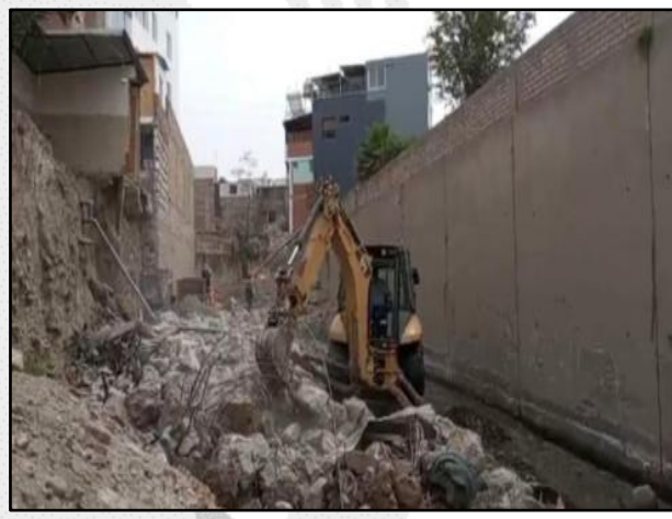
Limpieza y descolmatación de torrentera