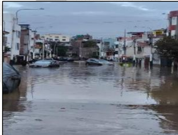
Afectación en el distrito de Yanahuara

Distribución: A los tres niveles de Gobierno (Nacional, Regional y Local).