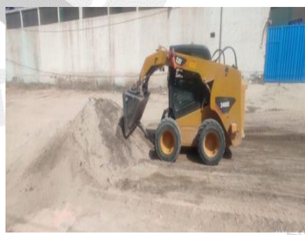
Limpieza y rehabilitación de vías