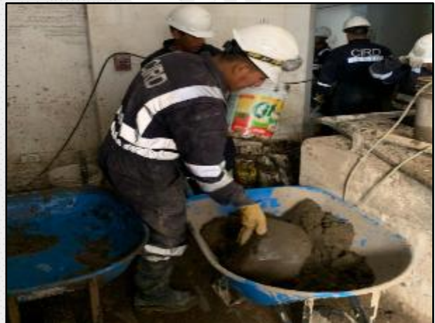
Trabajos de limpieza de viviendas distrito de Yanahuara