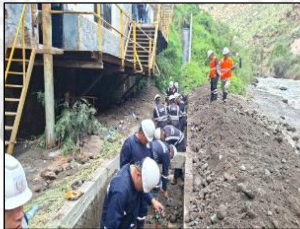
Lluvias intensas en el distrito de Cayma