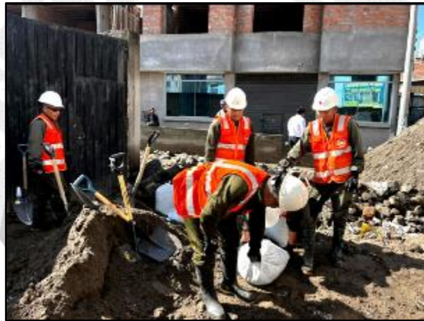
Brigada de Intervención Rápida para Desastres de la 3ra Brigada de Servicios realizan trabajos de limpieza, descolmatación y remoción de escombros en el distrito de Paucarpata