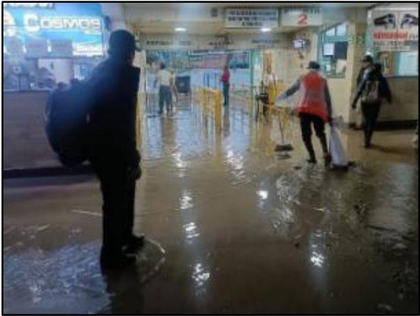
Inundación en el terminal terrestre distrito de Jacobo Hunter