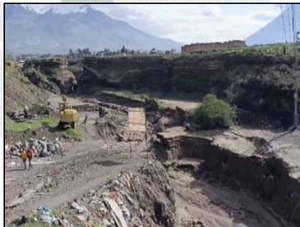
Vías afectadas en el distrito de Cerro Colorado