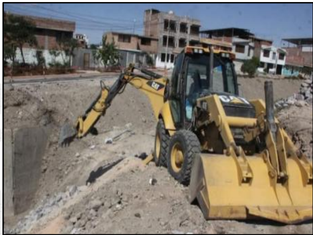
Obras civiles preliminares para la instalación del puente tipo Bailey