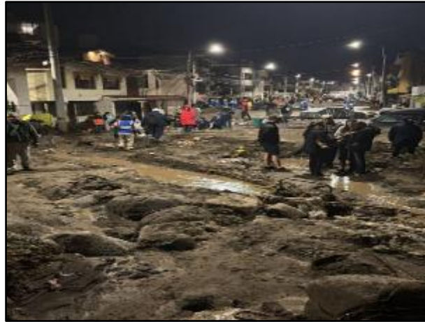
Caída de postes afectan el servicio eléctrico en el distrito de Yanahuara