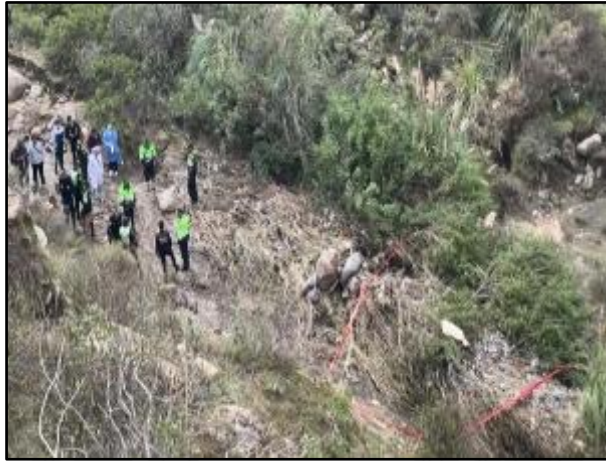
Acciones recuperación y levantamiento de los cadáveres en el distrito de Cayma