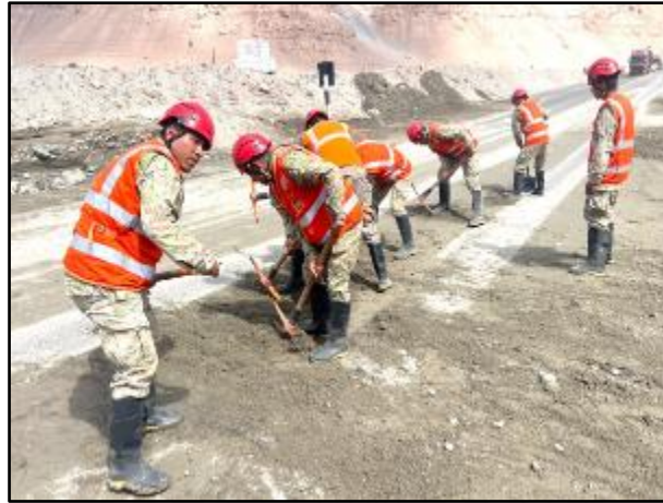
Lluvias intensas en el distrito de Vitor