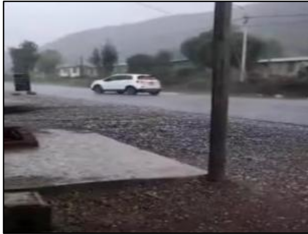
Lluvias intensas en el distrito de Pucallpa