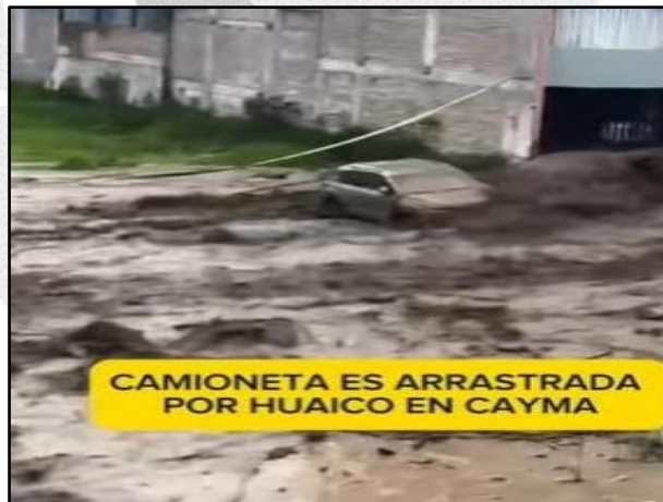
Huaico en el distrito de Cayma