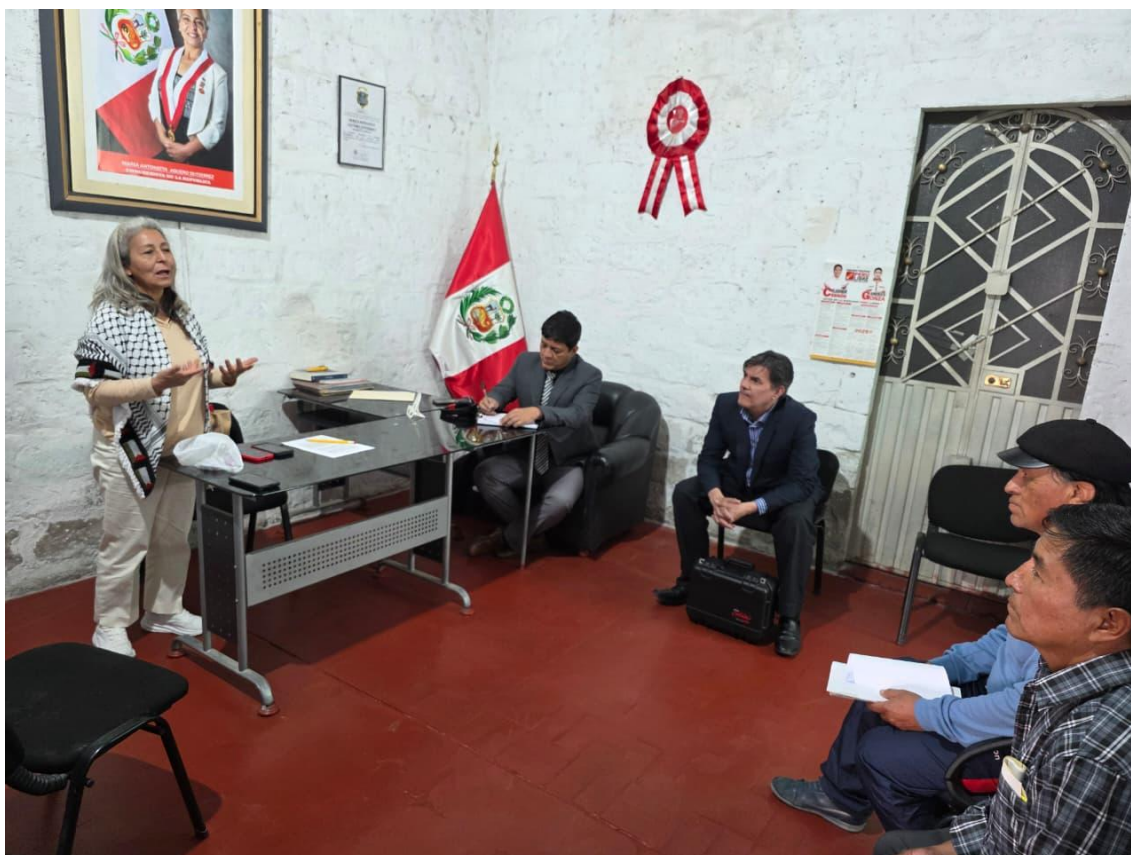
Figura 7. Reunión.