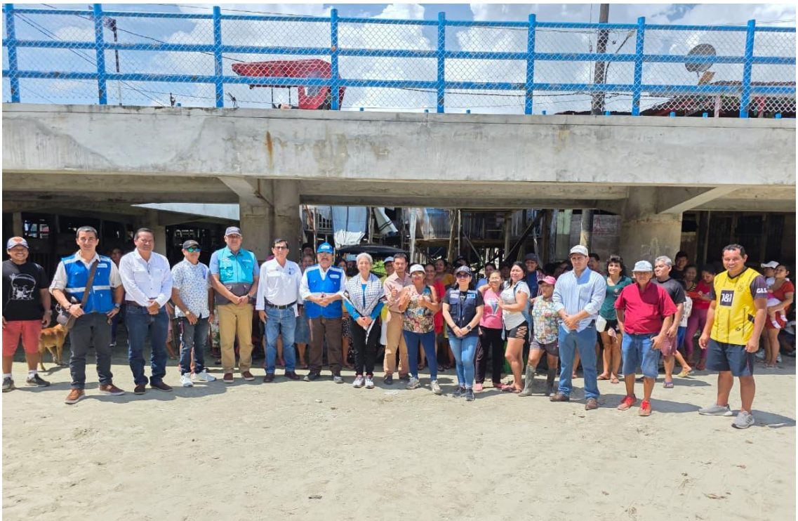
Figura 12. Foto Protocolar