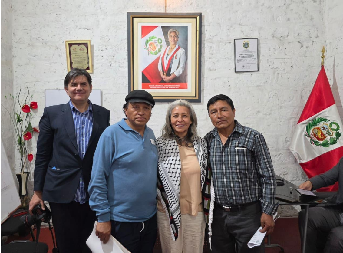
Figura 8. Foto protocolar.