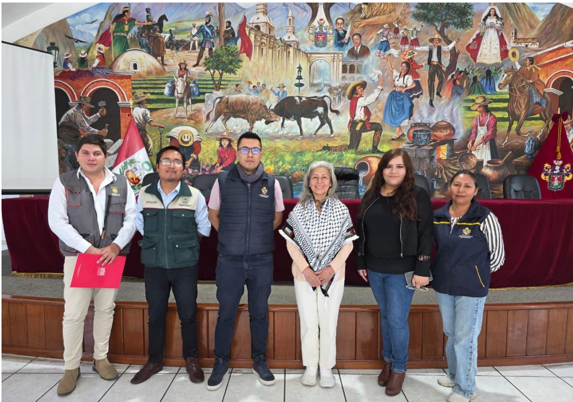
Figura 6. Foto Protocolar