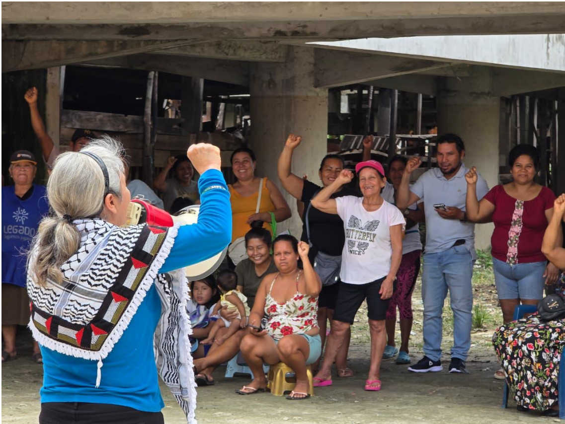
Figura 11. Reunión