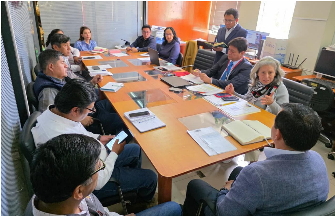
Figura 1. Reunión.