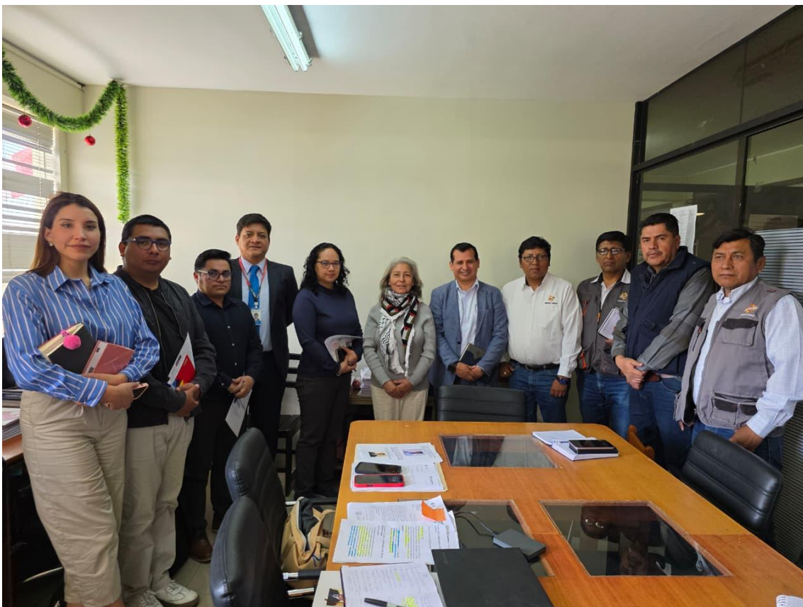
Figura 2. Foto protocolar.