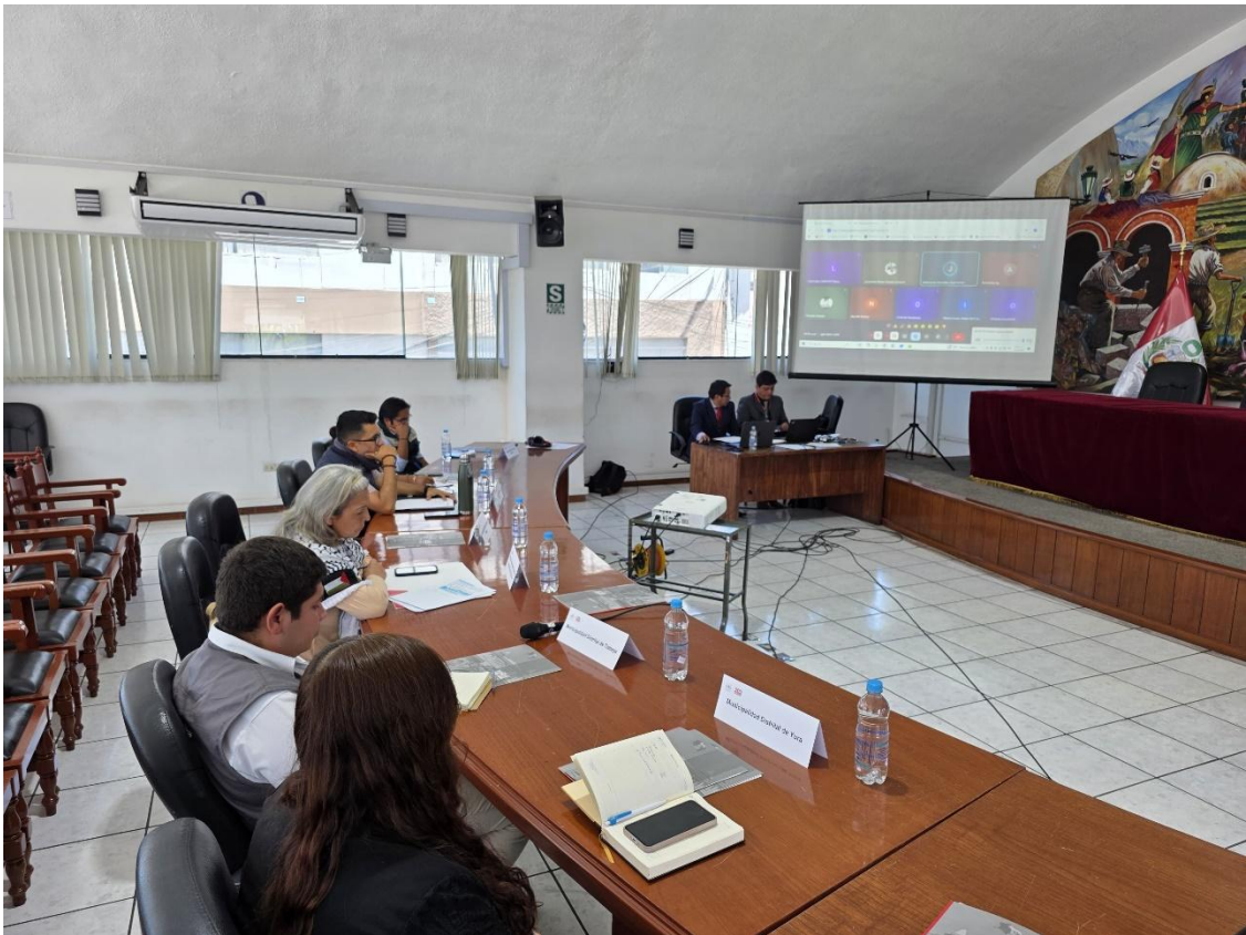
Figura 5. Reunión