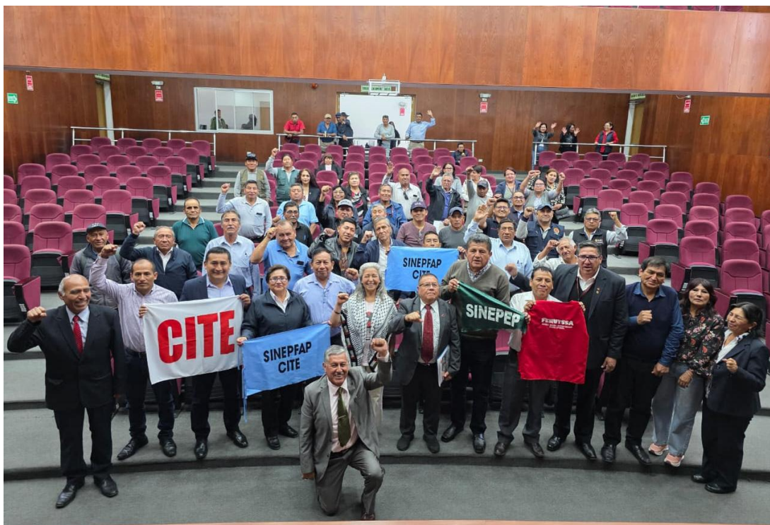
Figura 4. Foto protocolar.