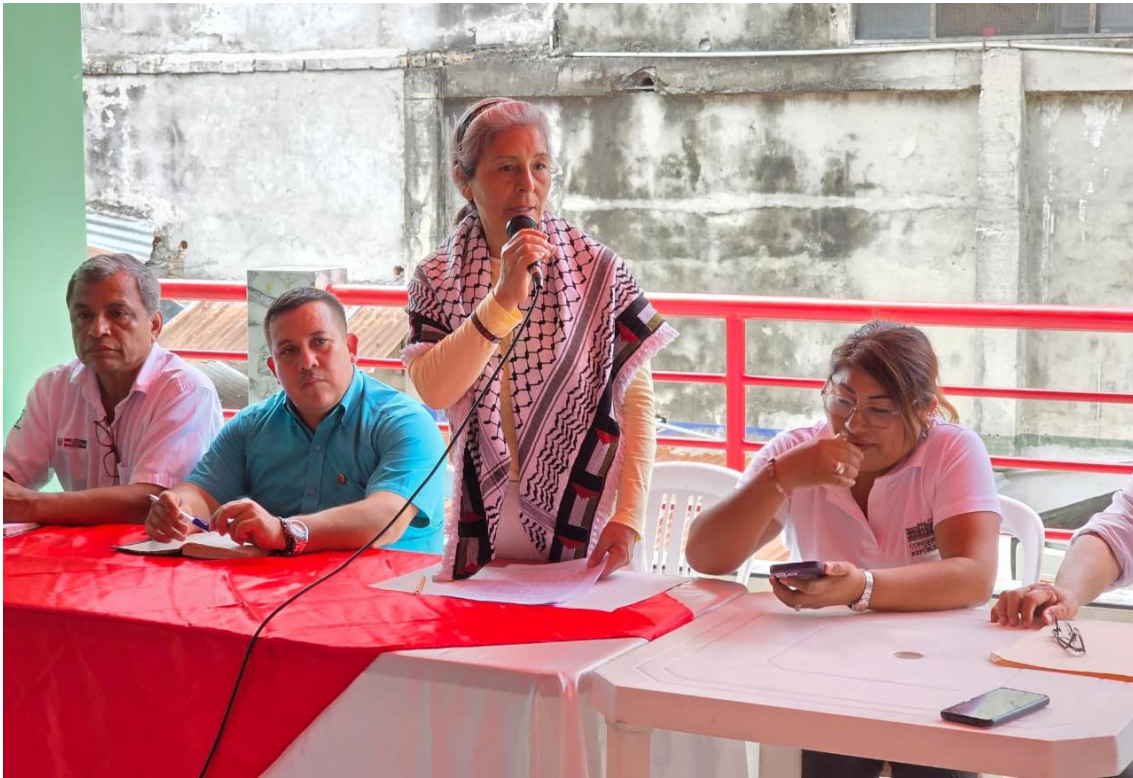
Figura 9. Reunión.