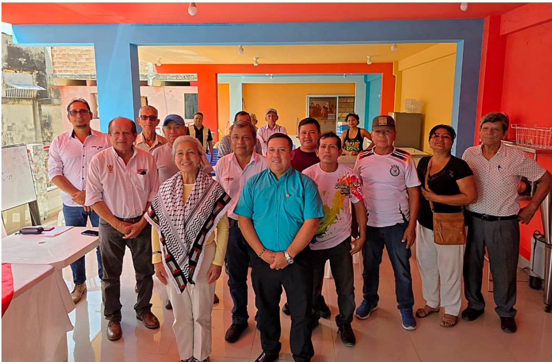
Figura 10. Foto protocolar.