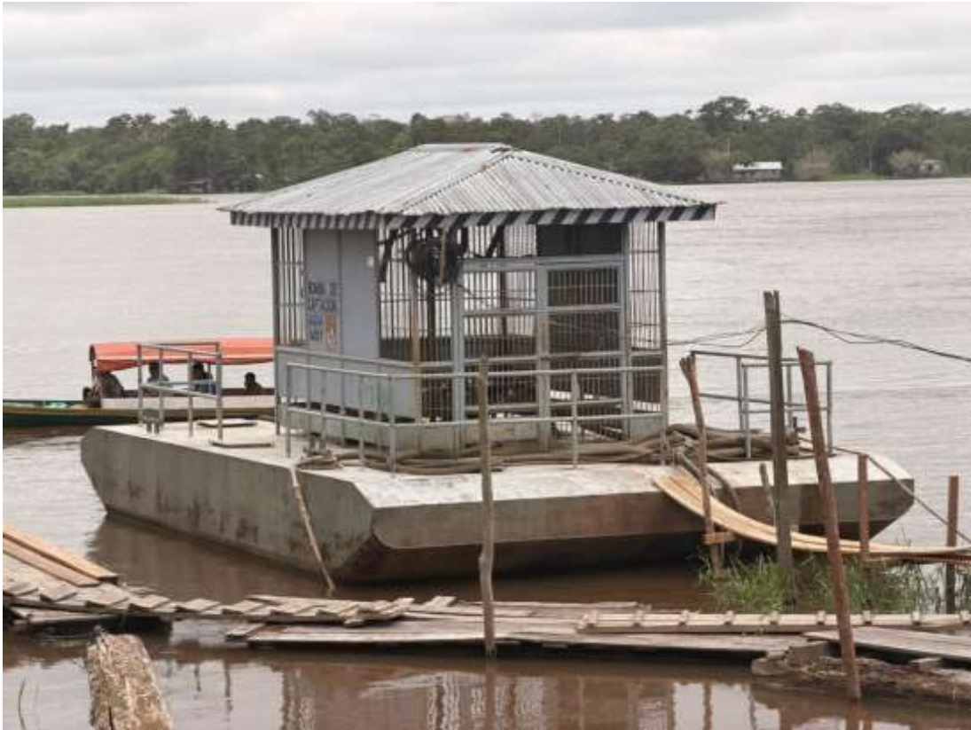
Figura 11. Bomba de captación de agua de la Municipalidad Distrital de Yavari