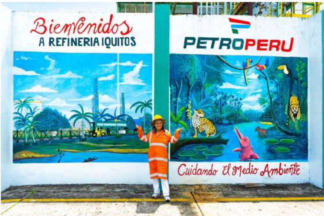
Figura 4. Mural de la refinería de Iquitos