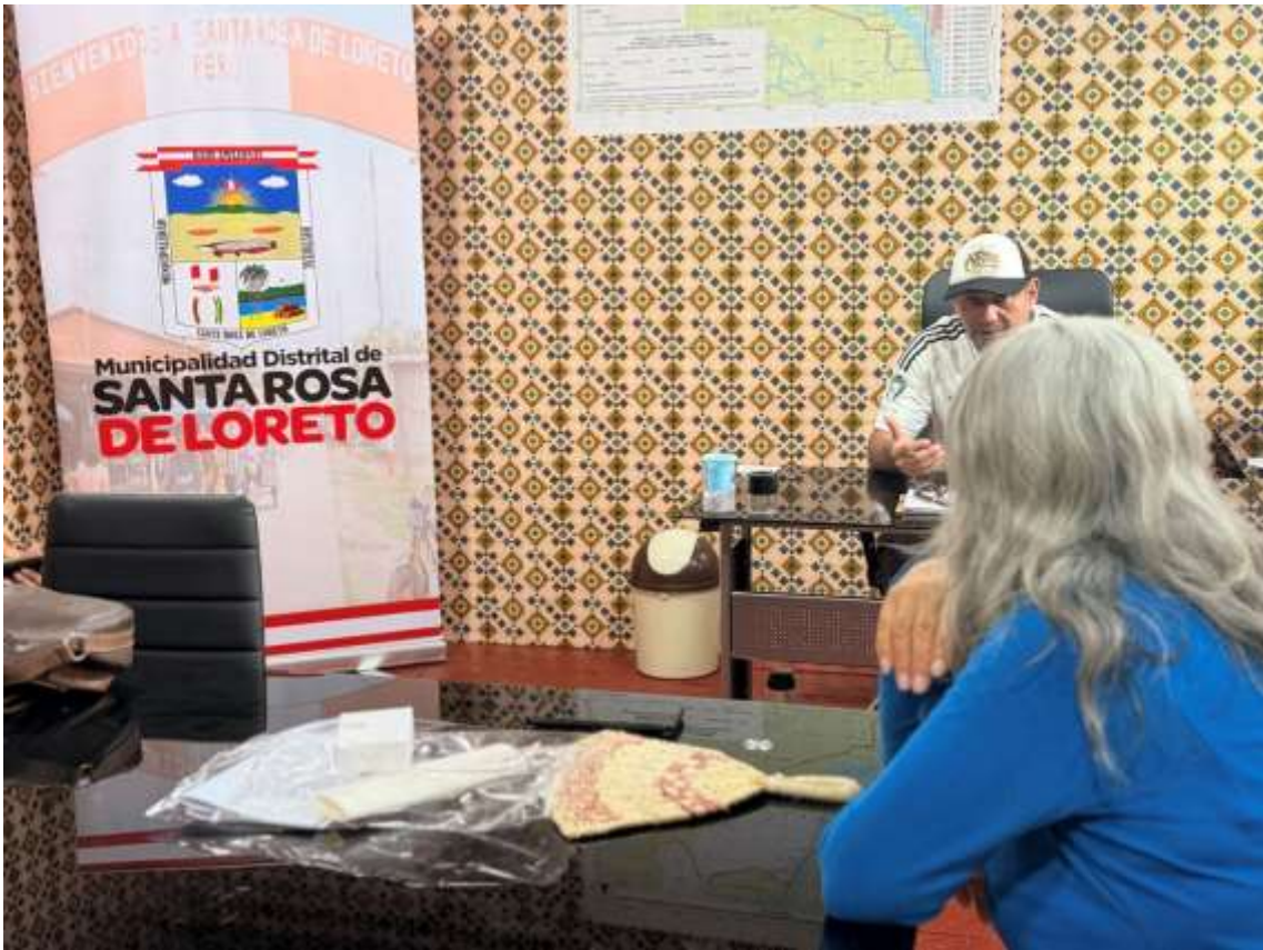
Figura 6. Reunión.