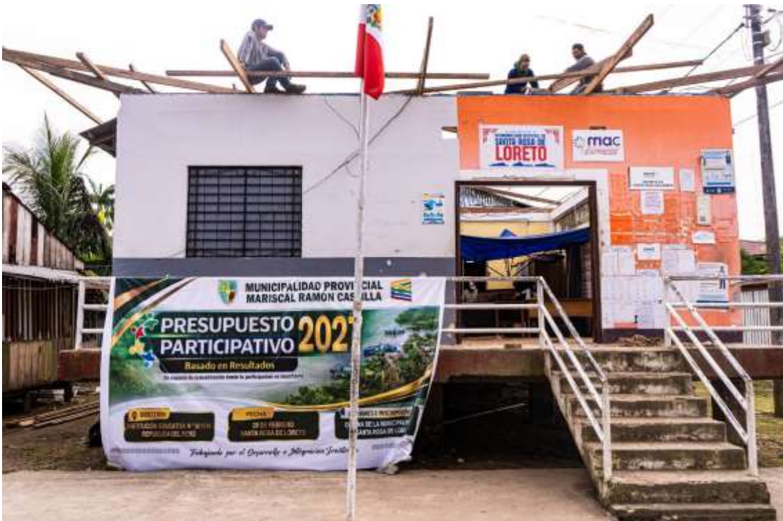
Figura 7. Frontis de la municipalidad en construcción.