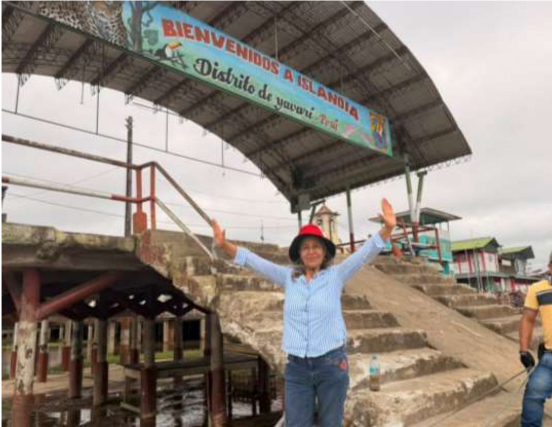
Figura 10. Muelle de Ingreso a Islandia