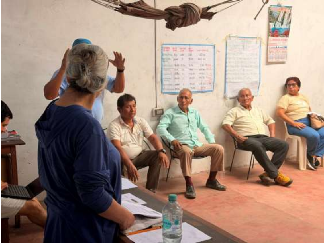
Figura 1. Reunión.