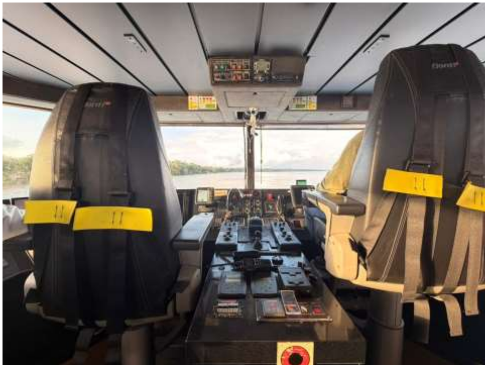
Figura 21. Fotografía del interior de la cabina