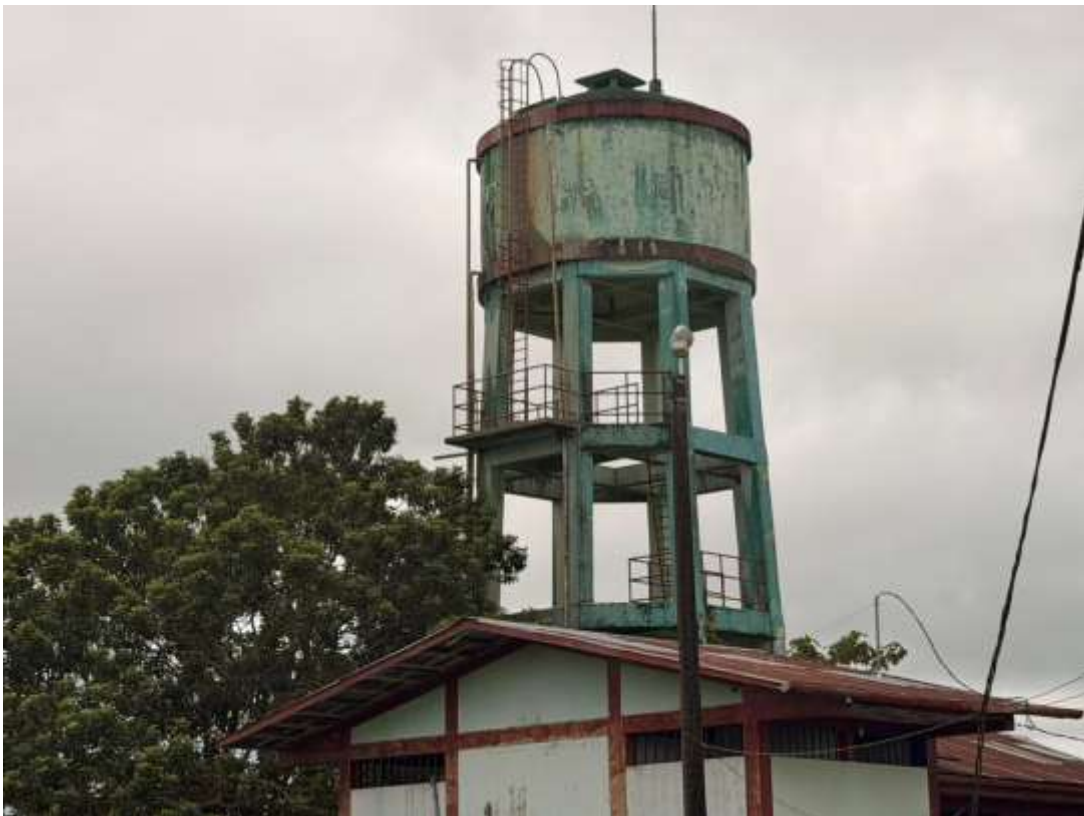
Figura 12. Reservorio de agua.