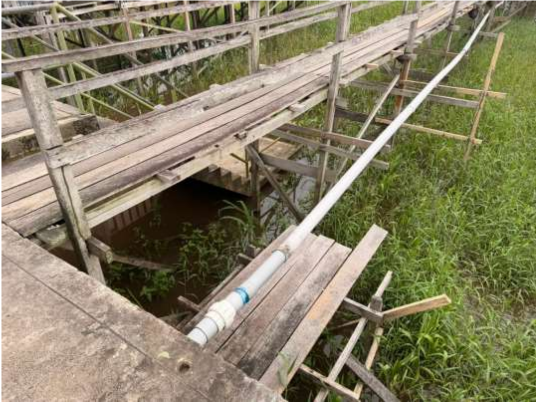
Figura 15. Vista de conexiones de agua potable