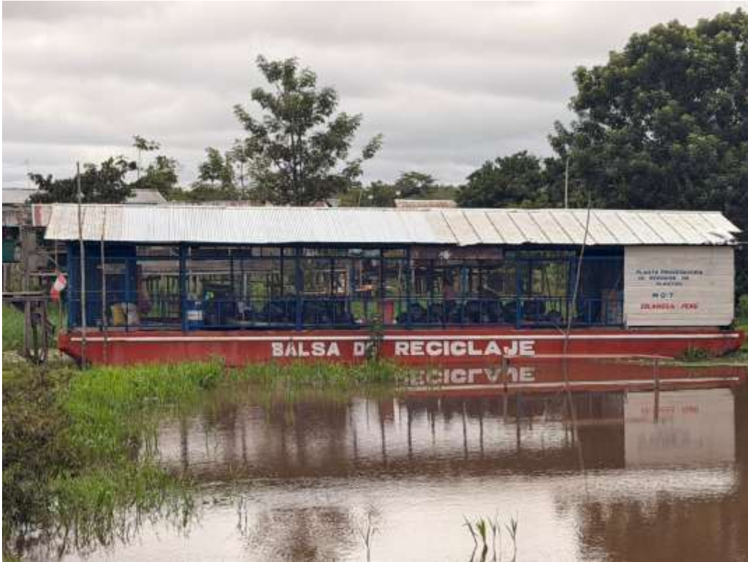
Figura 17. Balsa de reciclaje.