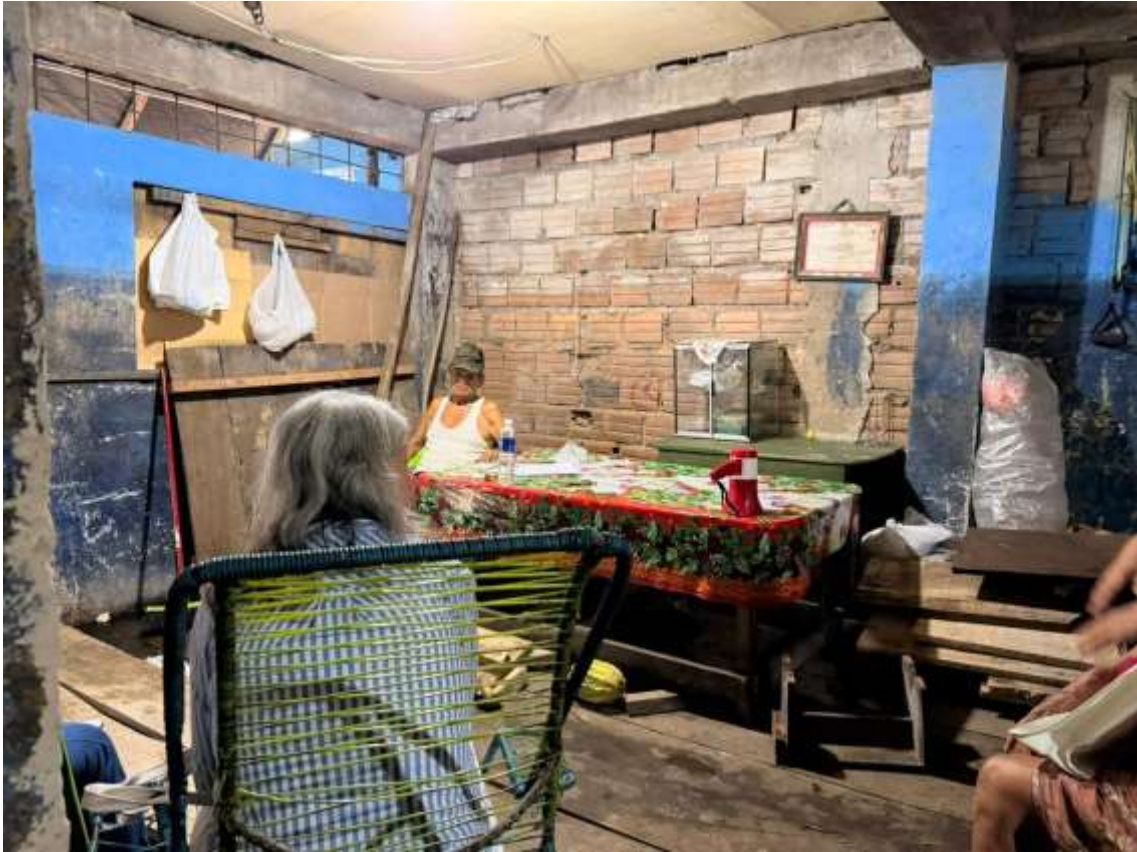
Figura 23. Reunión con dirigente del bajo Belén