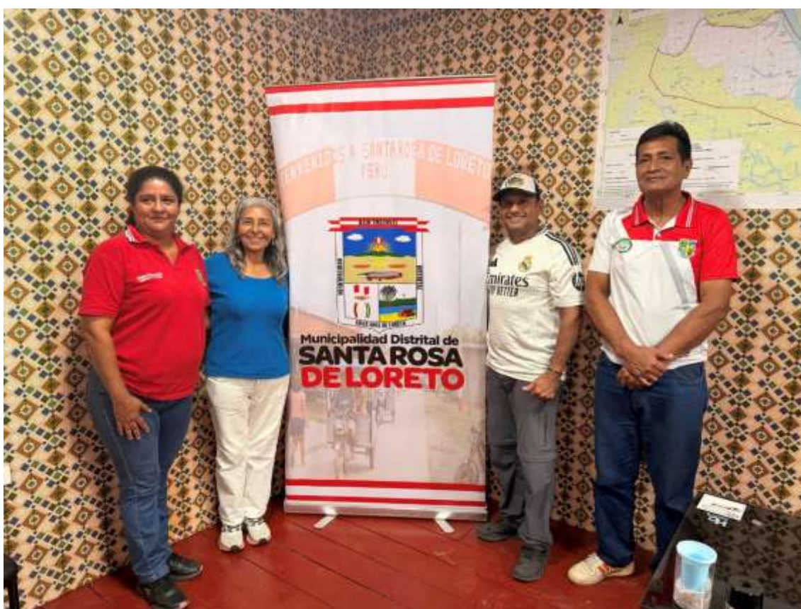
Figura 8. Foto protocolar.