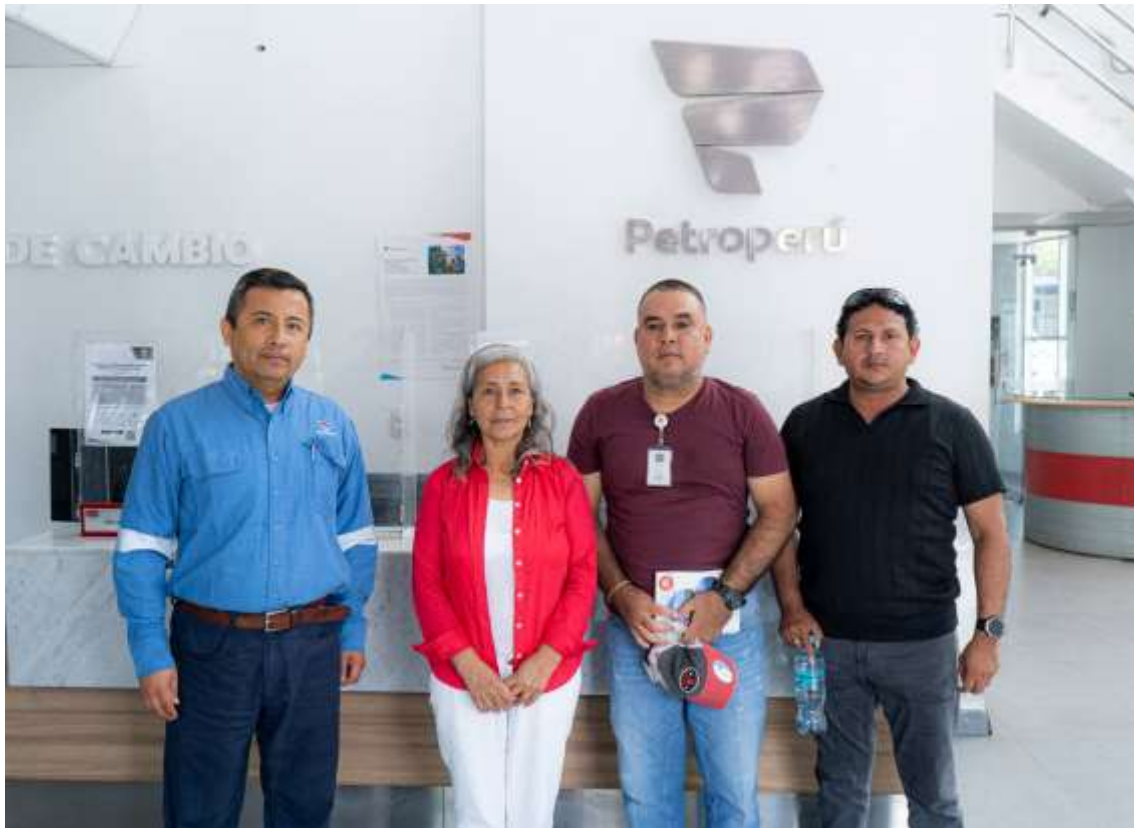
Figura 5. Foto protocolar.