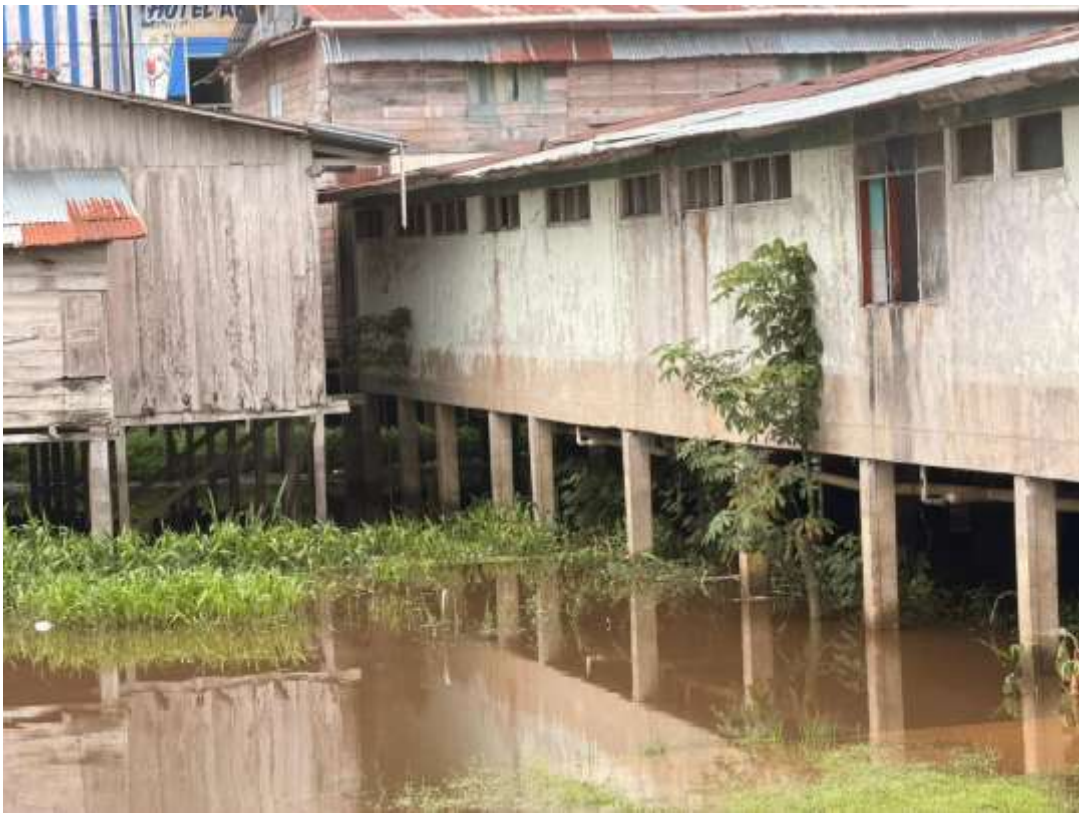
Figura 16. Visita de desagües