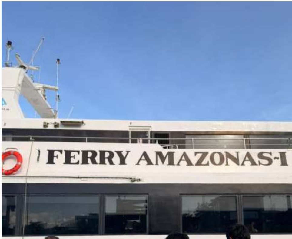
Figura 20. Fotografía del Ferry