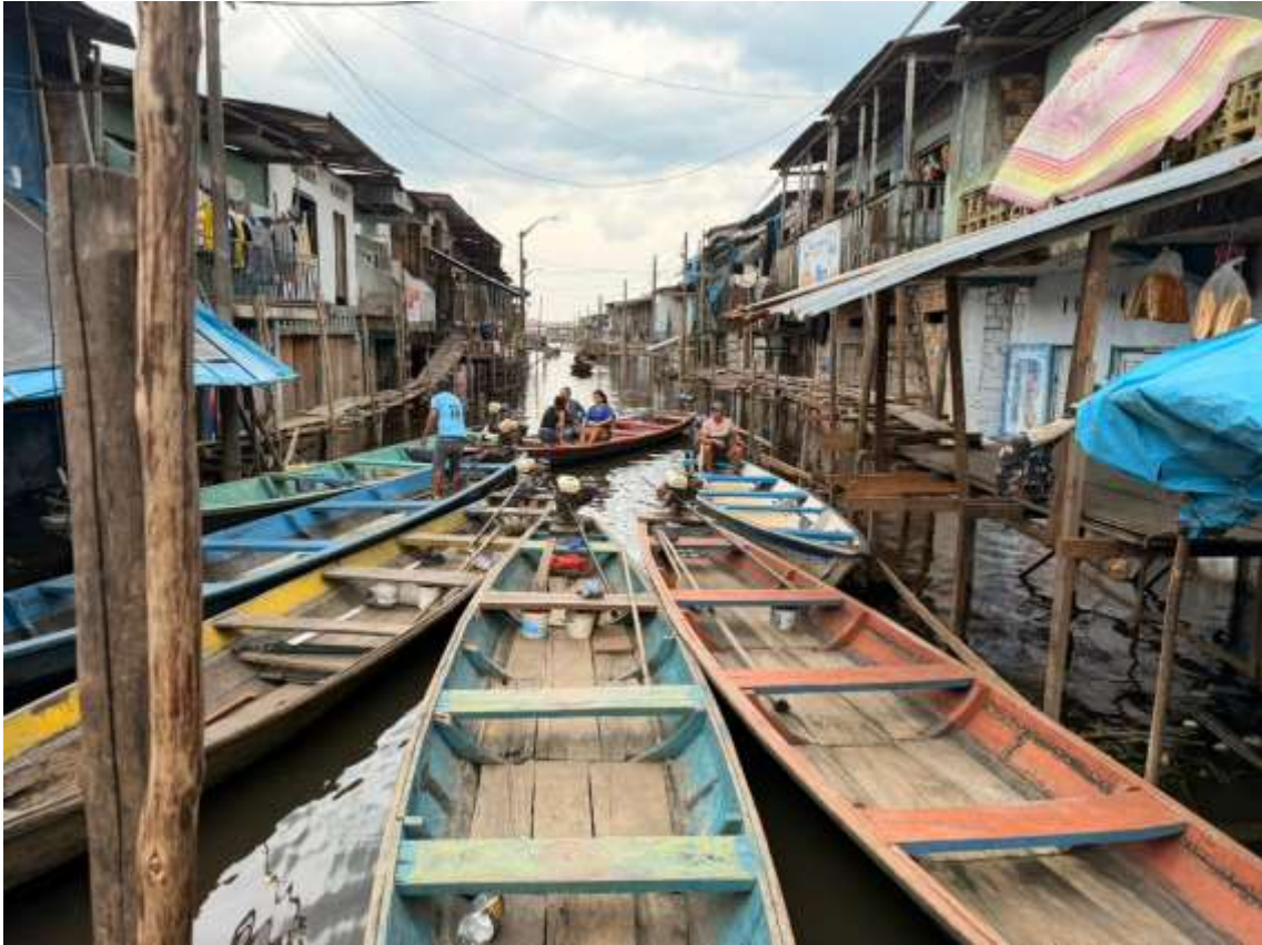
Figura 22. Fotografía del Bajo Belén