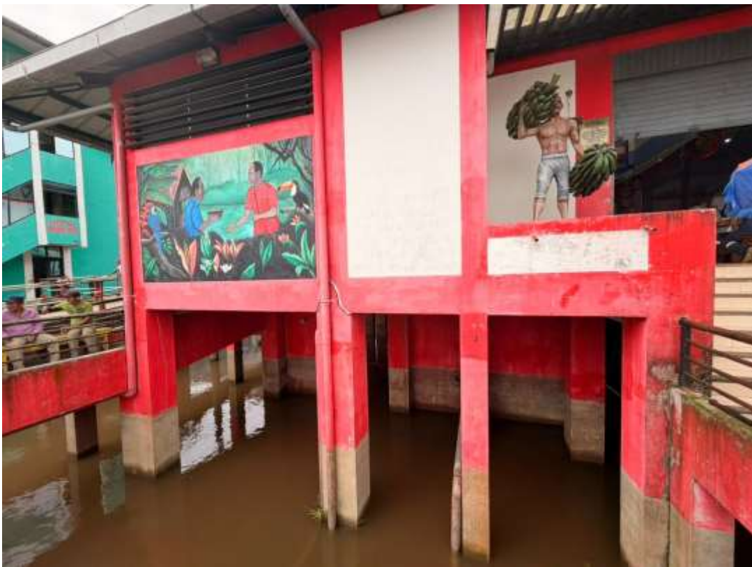
Figura 14. Vista de los drenajes pluviales