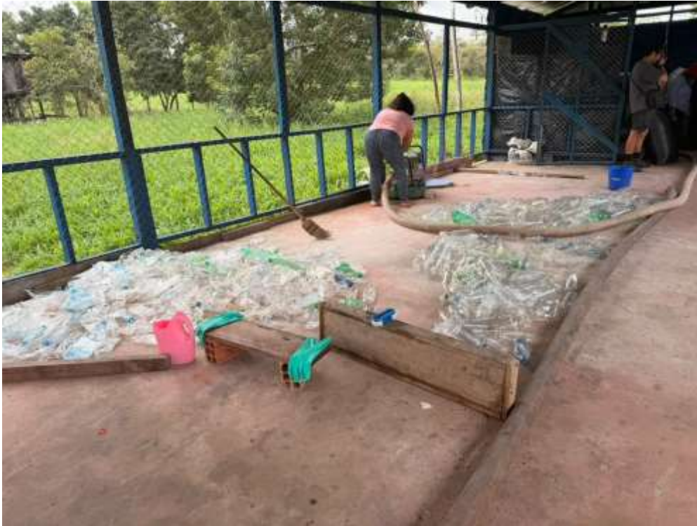
Figura 23. Actividades de reciclaje