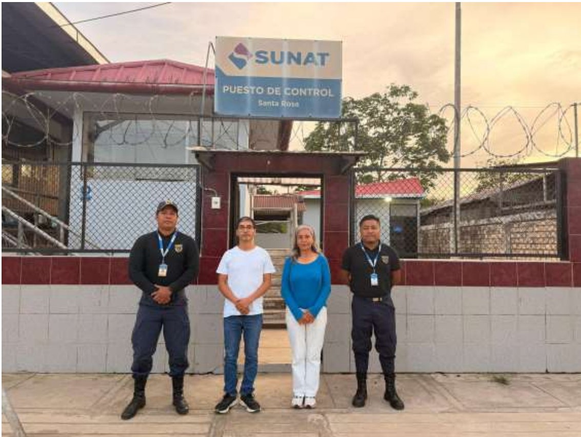
Figura 9. Foto protocolar