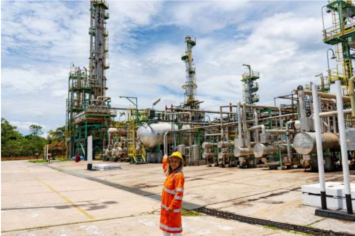
Figura 3. Refinería de Iquitos