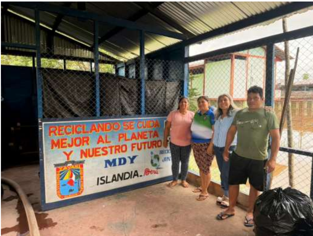
Figura 18. Fotografía protocolar.