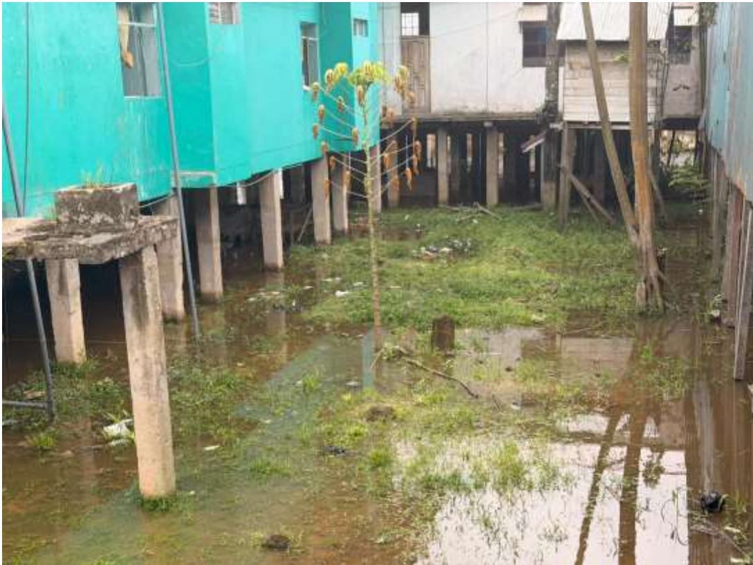
Figura 13. Vista de la infraestructura en zonas inundables