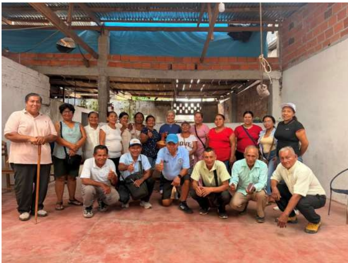
Figura 2. Foto protocolar.