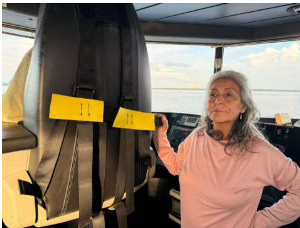
Figura 19. Fotografía del interior de la cabina

El viaje contra corriente implica mayor consumo de combustible, menor velocidad de desplazamiento y mayores costos logísticos, lo que refleja una realidad estructural: la conectividad amazónica sigue siendo una brecha histórica del Estado.