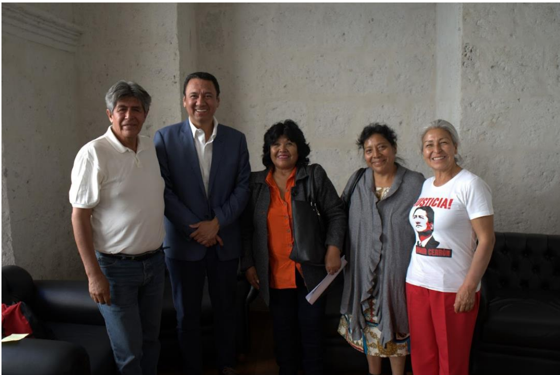
Figura 3. Fotografía protocolar

Me reuní con el Ministro de Desarrollo Agrario y Riego para abordar la problemática de las Asociaciones de Vivienda del Distrito de la Joya. Así mismo, se abordó la reglamentación de la Ley N° 31854, Ley que modifica la Ley 28667, Ley que Declara la Reversión de Predios Rústicos al Dominio del Estado, Adjudicados a Título Oneroso, con Fines Agrarios, Ocupados por Asentamientos Humanos.