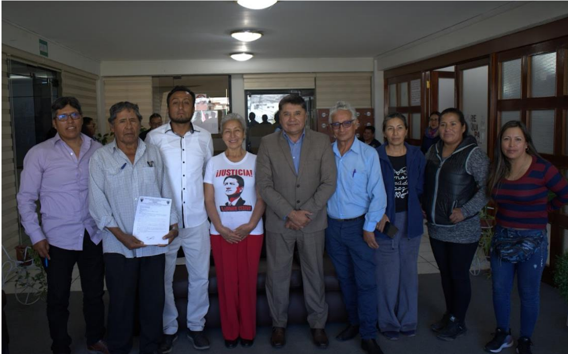
Figura 2. Fotografía protocolar