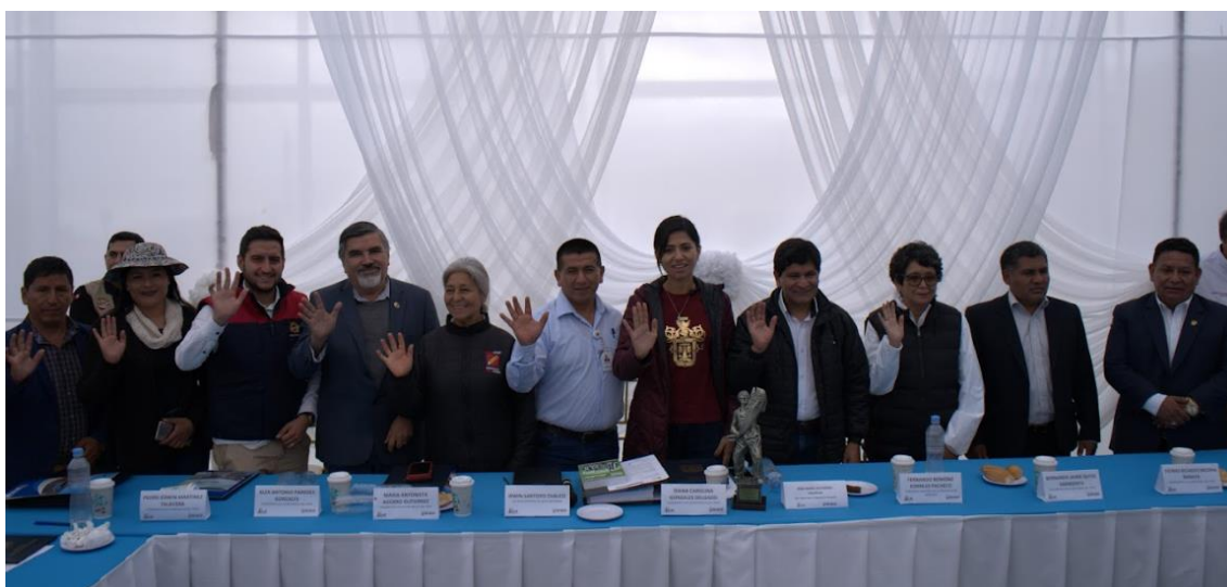
Figura 4. Fotografía protocolar

En la reunión del Grupo Multipartidario de Congresistas por la Región Arequipa se trataron los problemas que aquejaban a la provincia y distrito de Islay. Estos son el Talud Cerro Domo la Virgen y la Carretera Matarani - Arequipa - Yura – Patahuasi. Así como la construcción de la Industria Petroquímica y problemas relacionados a la minería.