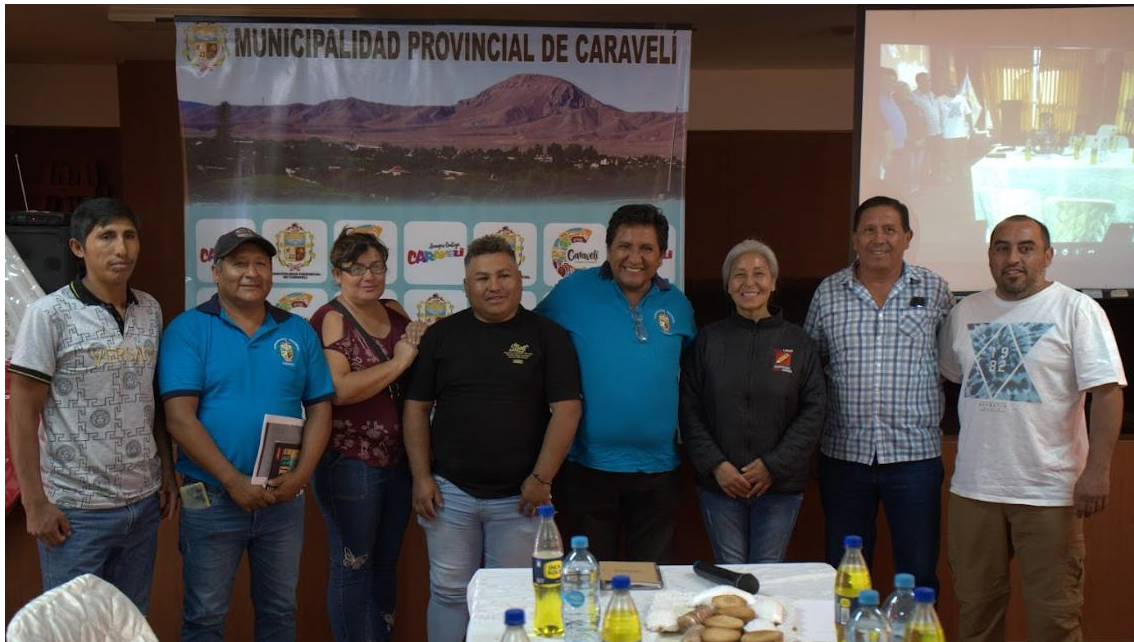
Figura 7. Fotografía protocolar