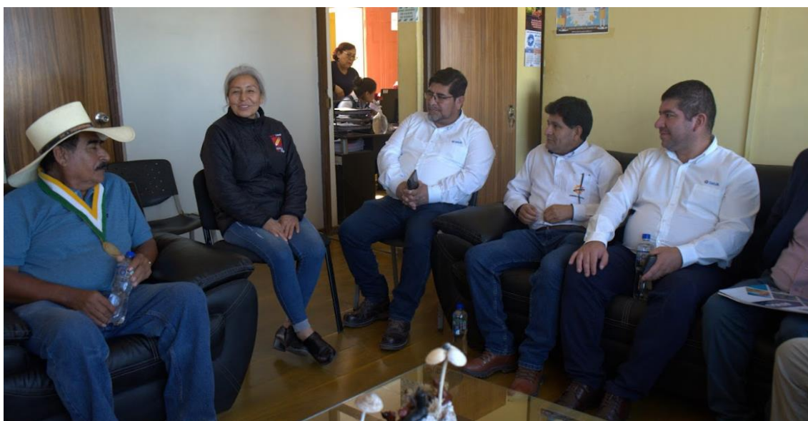
Figura 5. Reunión con los el Alcalde y Regidores de la Municipalidad distrital de Atico