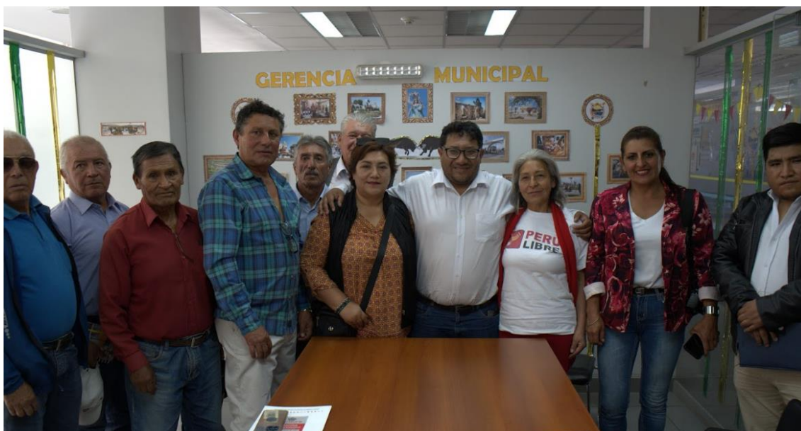
Figura 1. Fotografía Protocolar