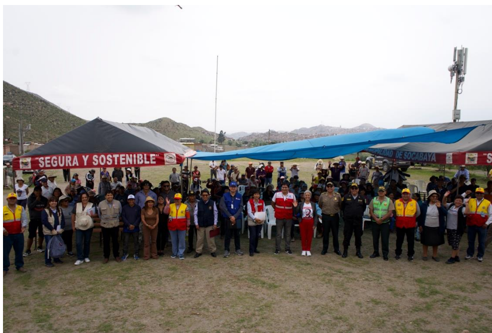
Figura 10. Reunión con las asociaciones

Finalmente, se pactó una reunión conjunta para el 5 de abril de este año, que incluirá a la Municipalidad Distrital y Provincial de Arequipa, la Dirección Descentralizada de Cultura y el Gobierno Regional, con el objetivo de avanzar en la resolución de este asunto.