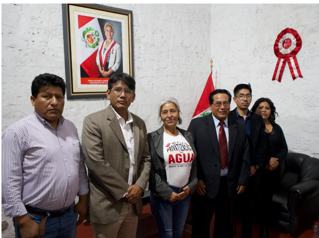
Figura 5. Reunión de trabajo con el Regidor y funcionarios de la Municipalidad Distrital de San Juan de Sigwas.

El martes 19 de marzo, a las 5:30 p.m., mantuve una reunión con el regidor y funcionarios de la Municipalidad Distrital de San Juan de Sigwas. En esta, se discutió la desmembración de terrenos a favor de las municipalidades de San Juan de Sigwas con el objetivo de priorizar ante el pleno el dictamen favorable de los Proyectos de Ley 2648/2021-CR y 4255/2022-CR. Estos proyectos, acumulados, buscan regularizar los terrenos superpuestos con Autodema. Se informó que el PL 2648/2021-CR ya cuenta con un dictamen favorable y ha sido priorizado para su votación en el pleno del Congreso. Asimismo, se coordinó con el congresista Edwin Martínez, autor del PL