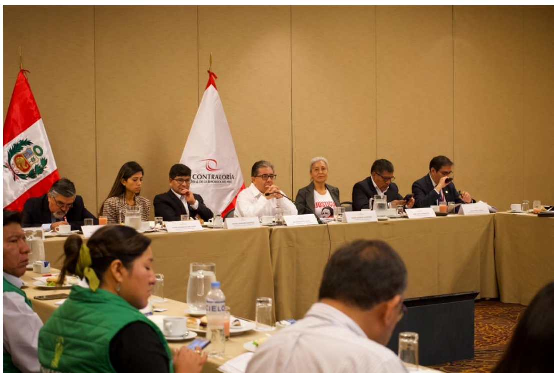
Figura 1. Participación en la reunión multipartidaria