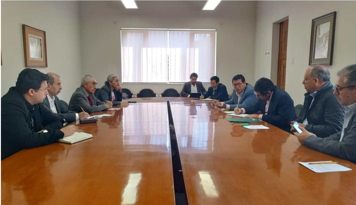
Figura 9. Reunión con la Cámara de Comercio de Arequipa sobre el Plan de Desarrollo Metropolitano