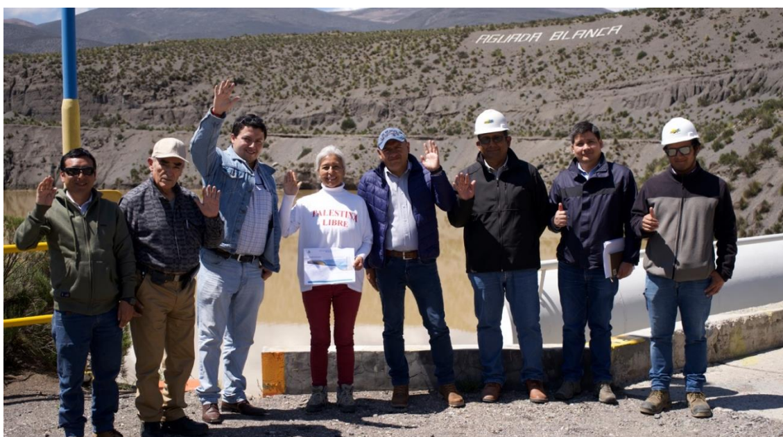
Figura 8. Realice una visita la represa Aguada Blanca y así mismo un recorrido a la Hidroeléctrica Charcani V

El 21 de marzo de 2024, realicé una visita a la Represa de Aguada Blanca junto a funcionarios de Autodema y Egasa. Durante esta visita, se observó que la represa está casi al máximo de su capacidad, específicamente al 97.45%, albergando 29.66 hectómetros cúbicos (HM 3 ) de agua, de una capacidad total de 30.43 HM 3 . La entrada de agua a la represa se registra en 30.24 metros cúbicos por segundo (m 3 /s), mientras que la salida es de 23.50 m 3 /s.