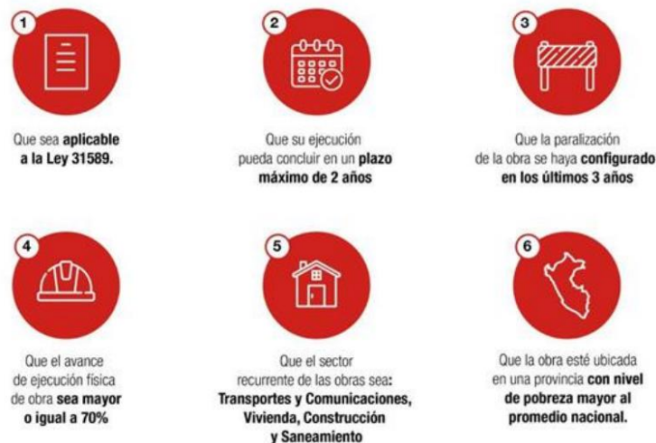
Figura 4. Criterios de priorización

Se propuso la reactivación de 24 obras en la región Arequipa.