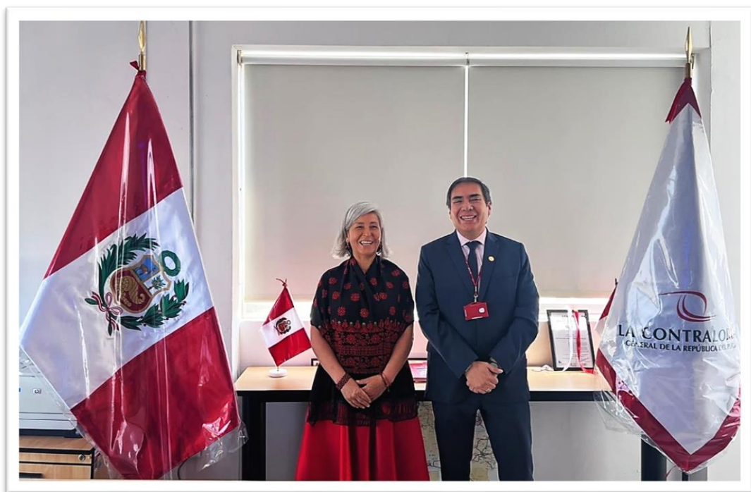
Figura 4. Foto protocolar

En atención a la reunión, el 14 de febrero de 2024 se cursó los oficios Ns° 208, 209, 210 y 211-2023-2024-MAG/CR, al Gerente de la Red Asistencial Arequipa de EsSalud, al Gobernador Regional de Arequipa, al Gerente Regional de Control de Arequipa y al Ministro de Salud, respectivamente, en los cuales se solicitaron los planes de mantenimiento preventivo y correctivo actualizados de los centros hospitalarios a su cargo y un informe detallado de las acciones realizadas para garantizar el cumplimiento de estos planes.