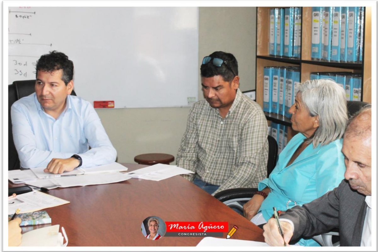
Figura 1. Participación en la reunión con el Gerente de Obras del Gobierno Regional de Arequipa

Reunión con el Gerente de Infraestructura del Gobierno Regional de Arequipa.