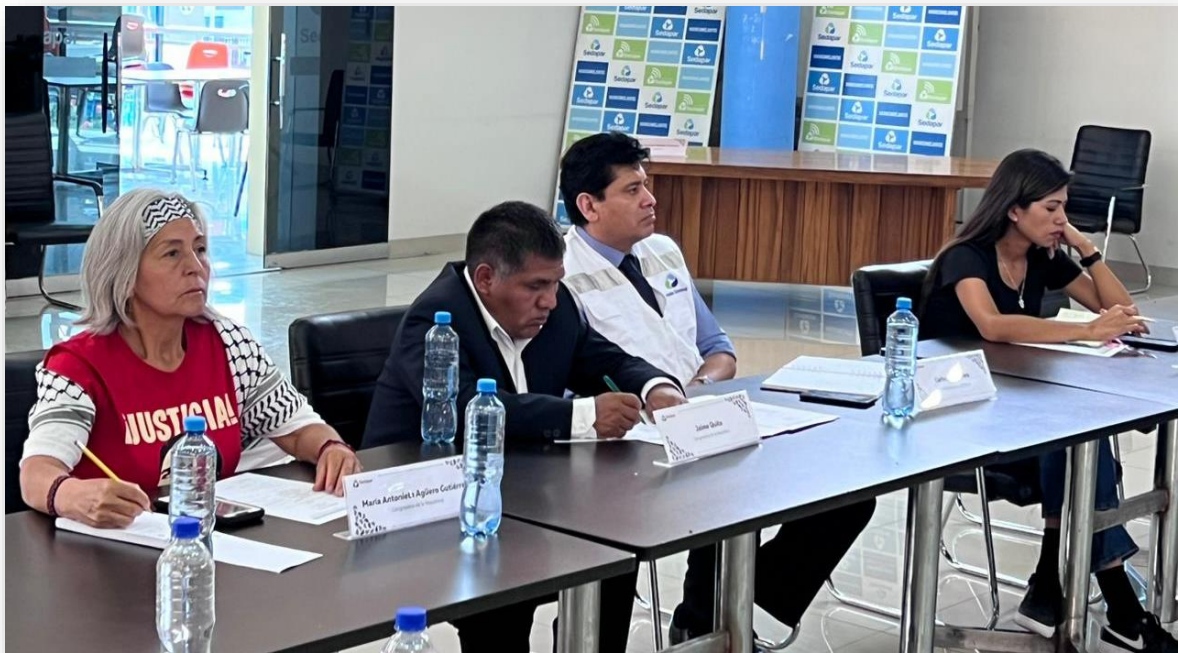
Figura 7. Reunión en la sede de SEDAPAR del grupo multipartidario de congresistas y otras instituciones del Estado.