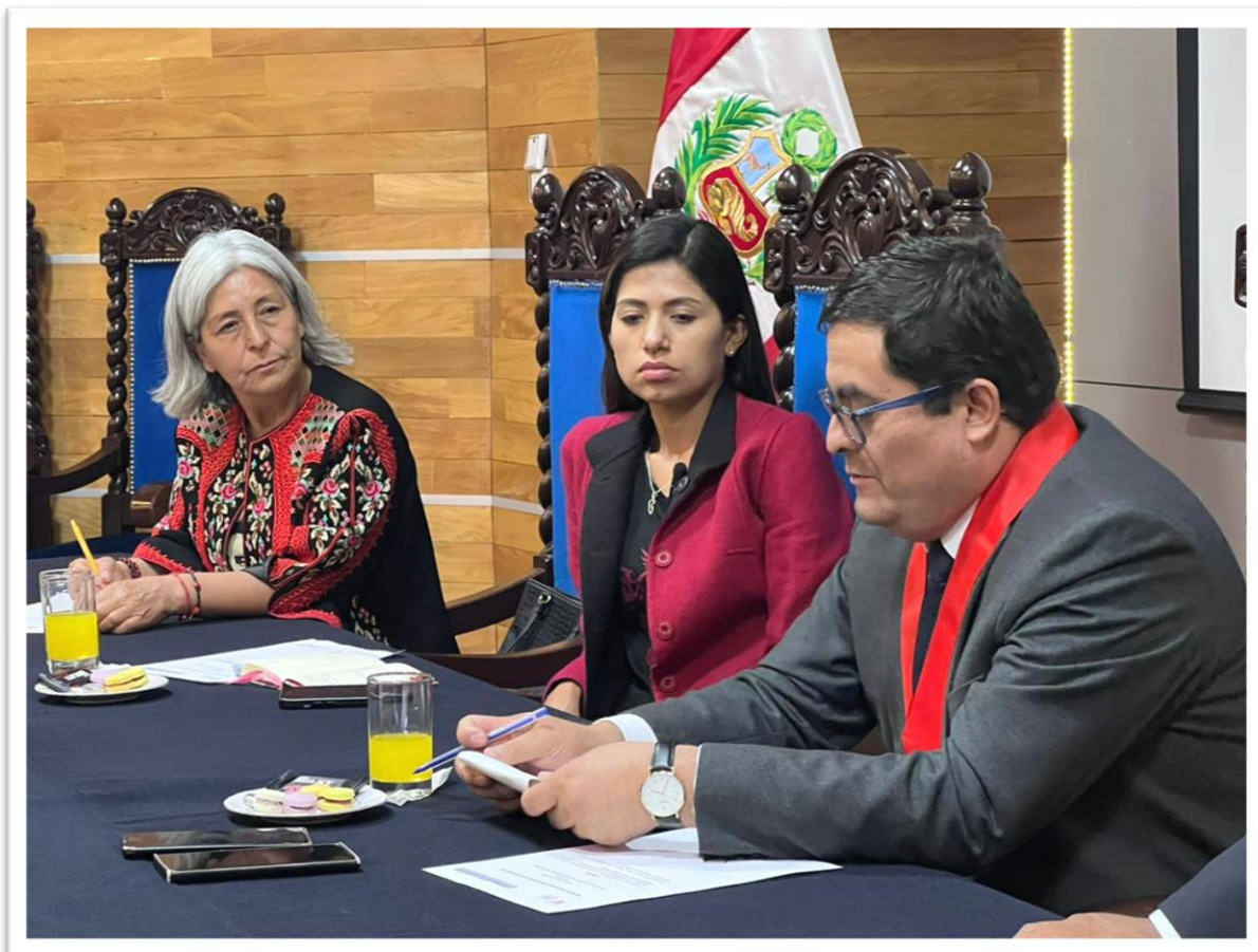
Figura 5. Reunión del Grupo Multipartidario de Congresistas de la Región Arequipa

Reunión del Grupo Multipartidario de Congresistas de la Región Arequipa con el Presidente de la Corte Superior de Justicia de Arequipa.