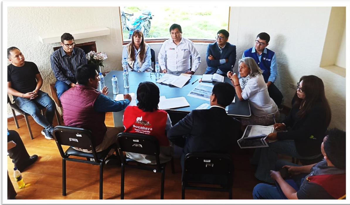
Figura 9. Mesa de Trabajo “Protección del Centro Arqueológico Monumental de Pillo - Socabaya”

MESA DE TRABAJO CON DDC CULTURA – AREQUIPA