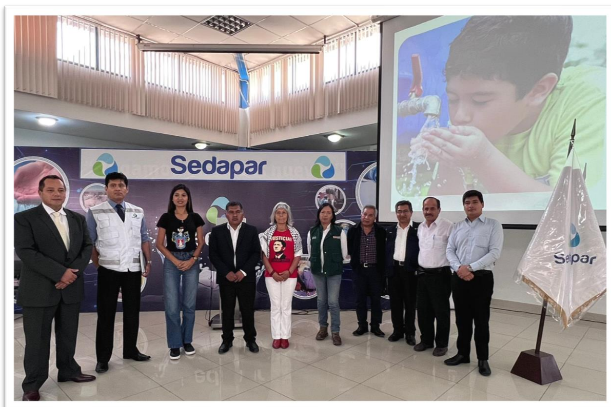
Figura 8. Foto protocolar de la reunión de trabajo en SEDAPAR

Asimismo, culminada la reunión en SEDAPAR, siendo las 11:30 de la mañana, los congresistas integrantes del grupo multipartidario de Arequipa, nos apersonamos a EGASA para dirigirnos al Dique Cincel y constatar in situ los daños ocasionados por la activación de la quebrada Matagente y Teleférico. En el lugar, logramos constatar los daños en los diques Cincel y Campanario, donde el huaico arrastro consigo lodo y árboles que obstruyeron de manera parcial dichos diques, asimismo, constatamos los trabajos de limpieza que estaban haciendo el personal de SEDAPAR en PTAP Miguel de la Cuba Ibarra y la tomilla, donde personal del ejército brindó su apoyo en la limpieza de escombros y restos de lodazal.