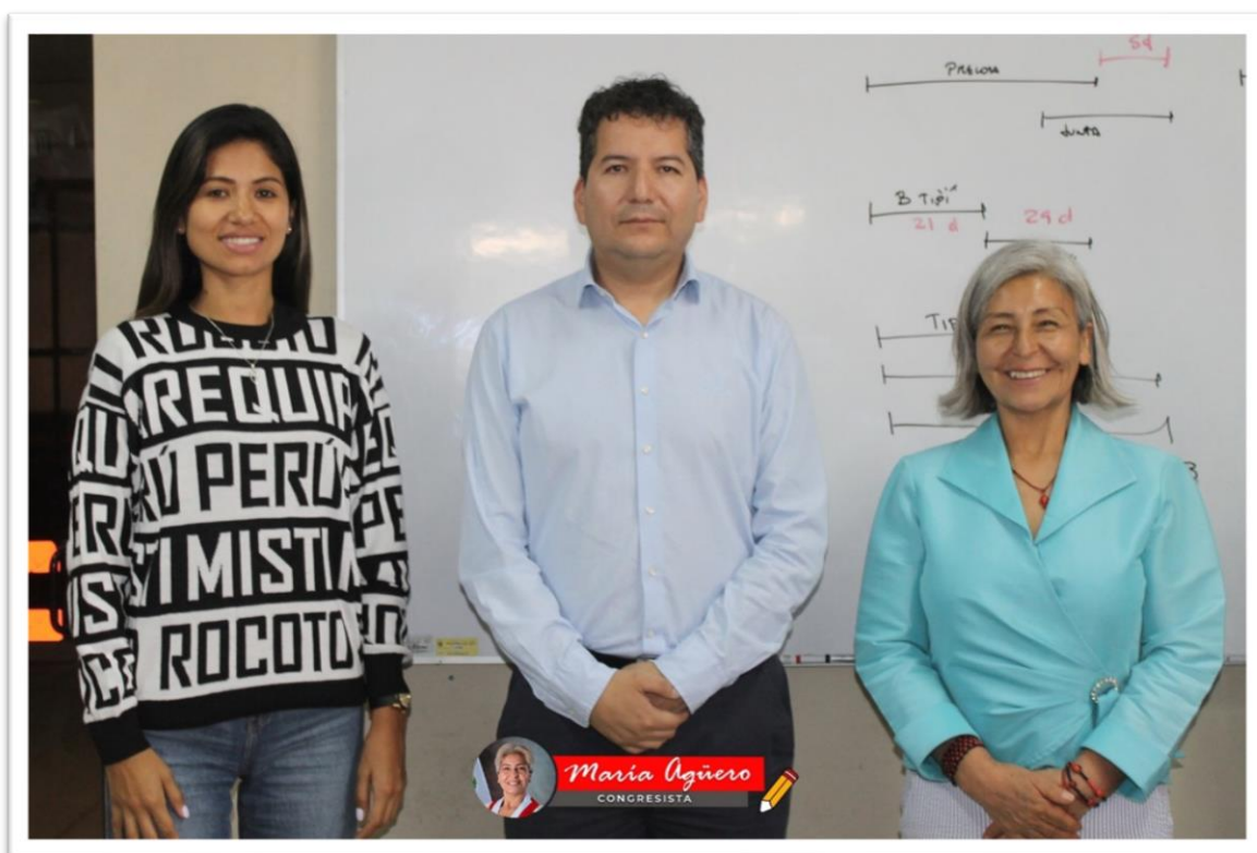
Figura 2. Fotografía protocolar