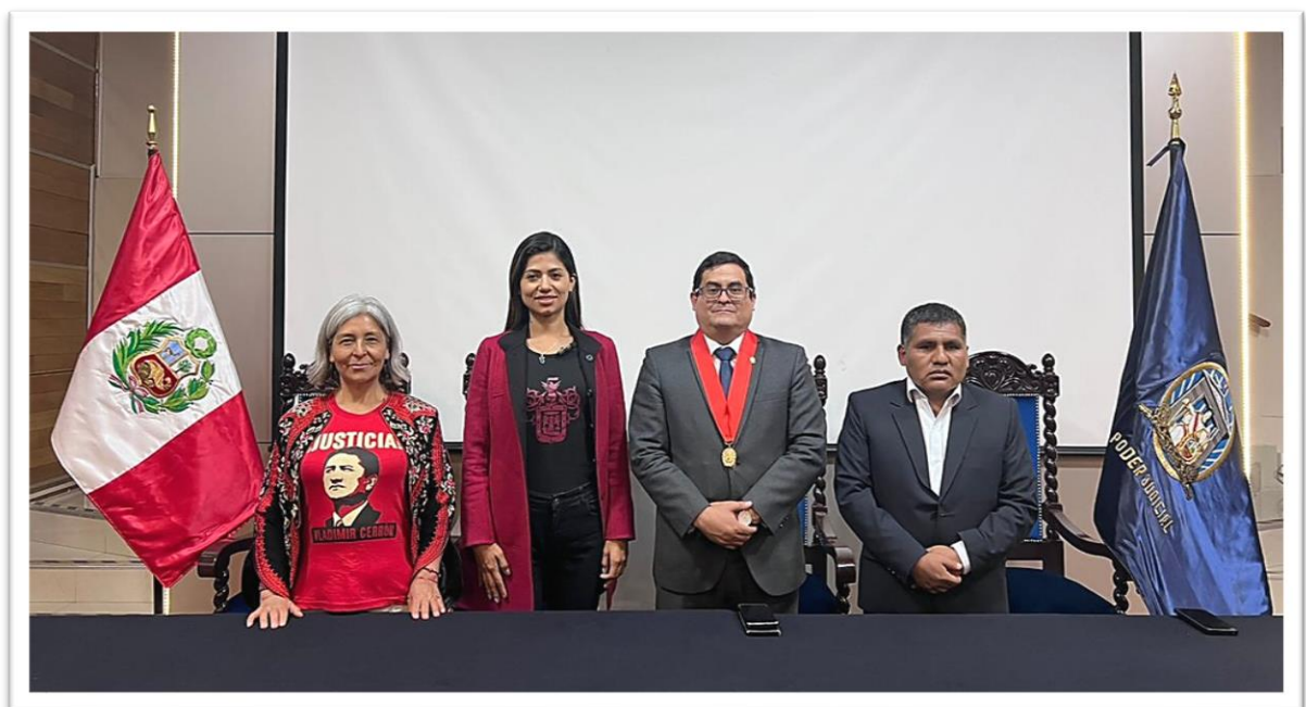
Figura 6. Fotografía protocolar

Finalmente, se acordó para los proyectos de ley propuestos por el Poder Judicial, conformar una mesa de trabajo entre el equipo técnico de los congresistas y la Corte Superior de Justicia de Arequipa.