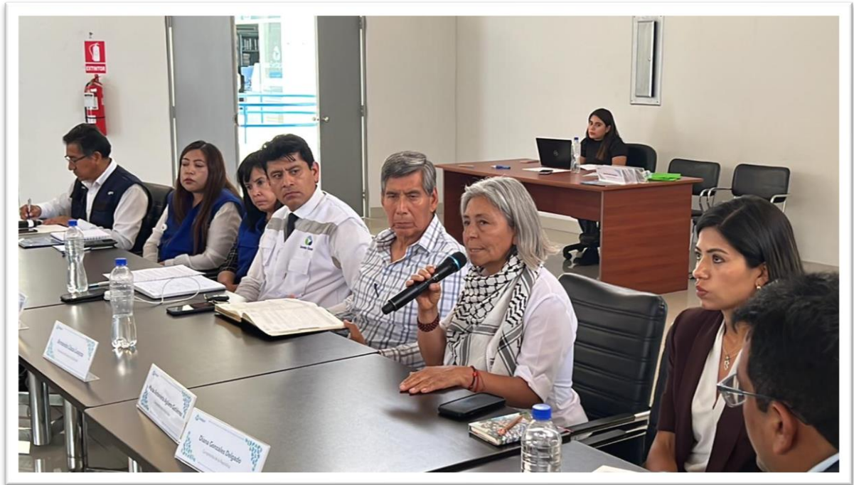
Figura 10. Reunión con el comité de calidad de agua - Arequipa

Siendo las 11:50 am, culminada la reunión con las autoridades convocadas para la mesa de trabajo de "Protección del Centro Arqueológico Monumental de Pillo - Socabaya", me dirigí a la reunión del comité de calidad de agua, donde se busca la manera de tener una reserva hídrica que pueda usarse de manera complementaria al tratamiento de agua del río Chili, ya que en algún momento podría darse una sequía que dejaría sin agua a Arequipa, de igual modo, se propuso la construcción de una nueva represa; asimismo, el Gerente de SEDAPAR informo las acciones que se tomaron ante el corte intempestivo de agua y el restablecimiento gradual del servicio.