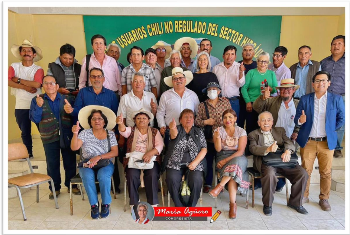
Figura 2. Reunión con la Junta de Usuarios de Chili - Arequipa

El día martes me reuní con la junta de usuarios Chili No Regulado, en la que abordamos una variedad de temas importantes relacionados con la agricultura, los recursos hídricos y el desarrollo regional en distintos distritos. Se identifica que hay más de 2000 agricultores minifundistas que requieren apoyo. Una preocupación crítica es la falta de recursos hídricos, con la ausencia de un embalse planificado y la necesidad urgente de un espejo de agua en San Juan de Tarucani. Esto se ve exacerbado por el aumento en la población, lo que impacta los recursos y servicios disponibles.