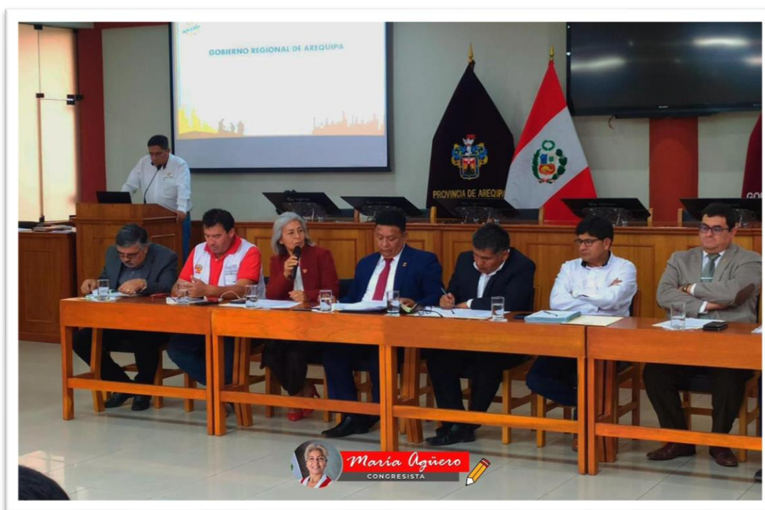
Figura 5: Reunión de trabajo del Grupo Multipartidario, denominada "Problemáticas, expectativas y articulación legislativa"

Finalmente se desarrolló la reunión de trabajo del Grupo Multipartidario, denominada "Problemáticas, expectativas y articulación legislativa", donde participé junto a mis colegas congresistas por Arequipa. Allí tratamos temas relacionados al sector salud, Majes Siguan I y II.