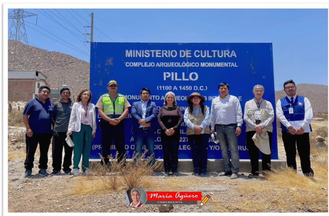
Figura 3. Fotografía in situ del parque arqueológico de Pillo

El día miércoles 10 de diciembre, me apersoné al centro arqueológico de Pillo, distrito de Socabaya, en compañía de miembros de las Policía Nacional del Perú, Dirección Desconcentrada de Cultura, Defensoría del Pueblo, COFOPRI y del gobierno regional de Arequipa, con la finalidad de verificar el estado actual del patrimonio cultural declarado por Decreto Supremo N° 207-INC.