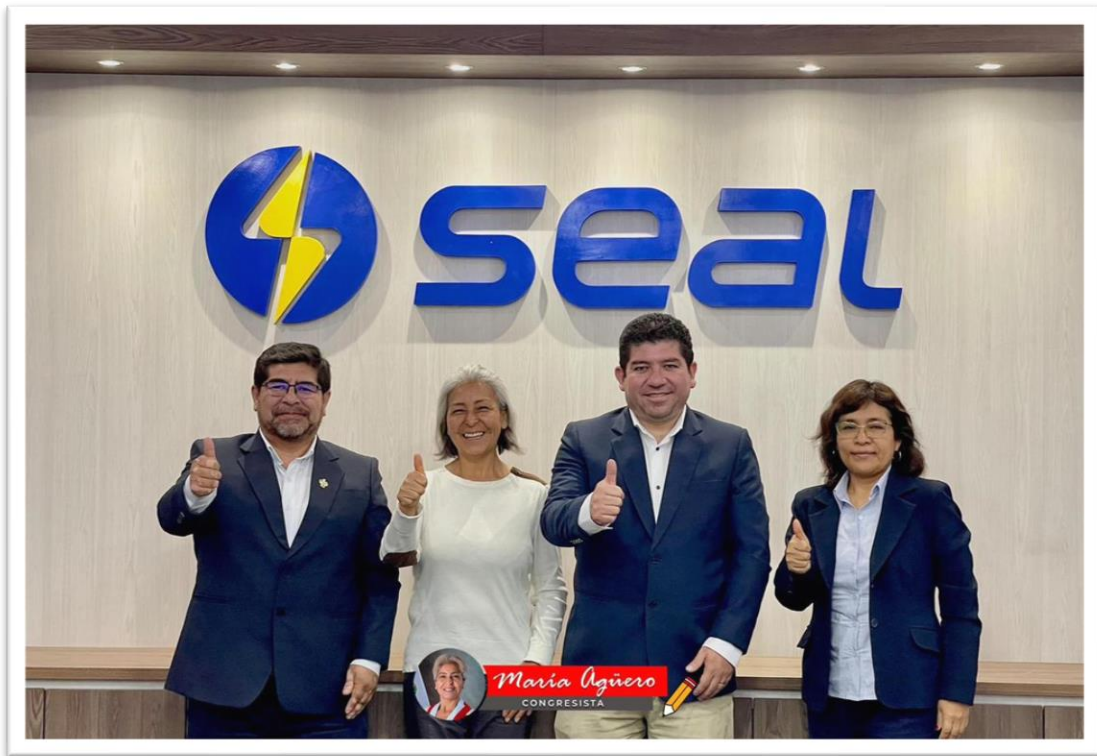
Figura 4. Reunión con SEAL

Esta reunión se realizó con la SOCIEDAD ELÉCTRICA DEL SUR OESTE S.A. – SEAL, con la cual los funcionarios de la institución detallaron la historia de la misma La Sociedad Eléctrica del Sur Oeste S.A., conocida como SEAL, fue establecida el 18 de marzo de 1905 en Arequipa, Perú. Su historia abarca más de un siglo de contribuciones al sector eléctrico, marcando su presencia como un actor fundamental en la región.