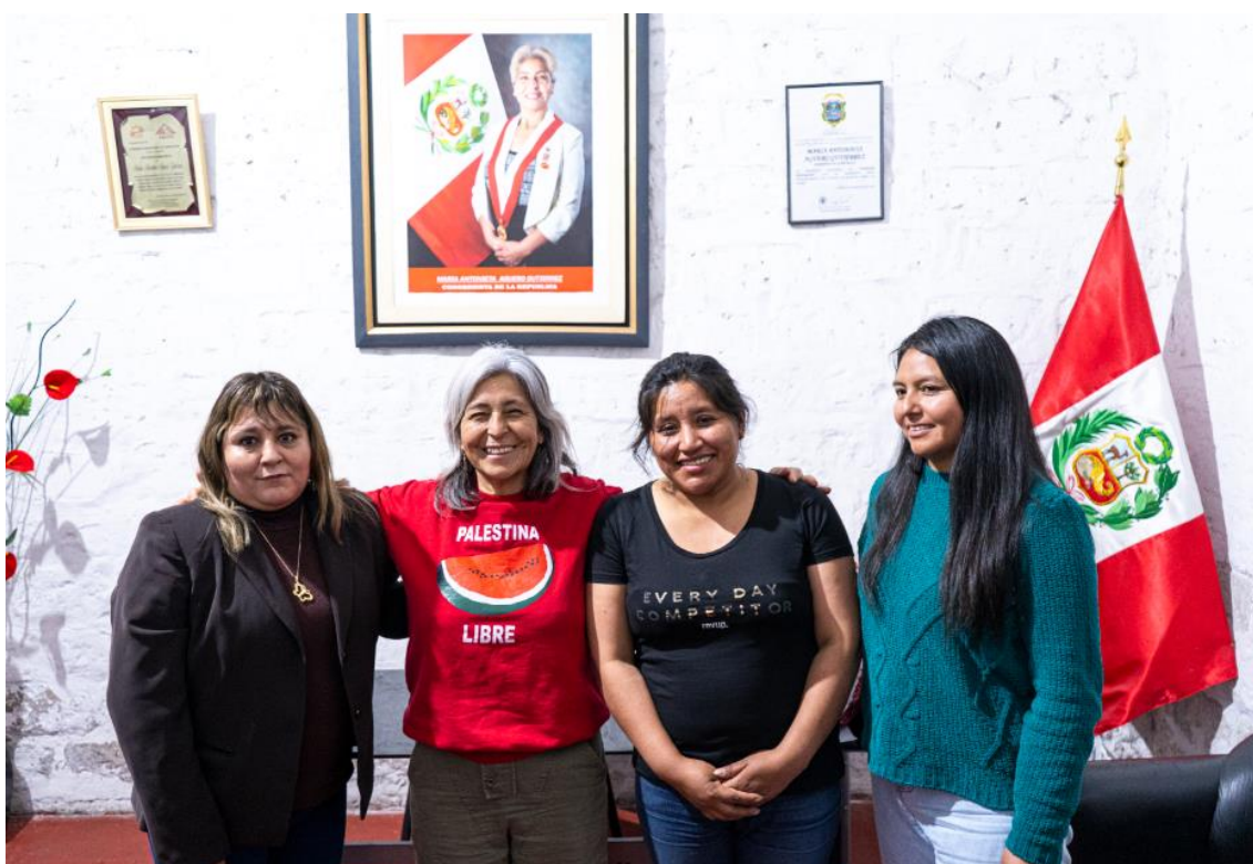
Figura 3. Fotografía protocolar