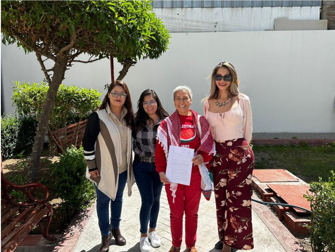
Figura 2. Fotografía protocolar