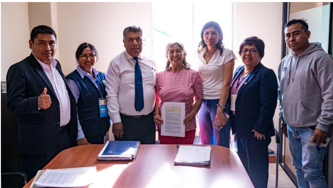
Figura . Reunión