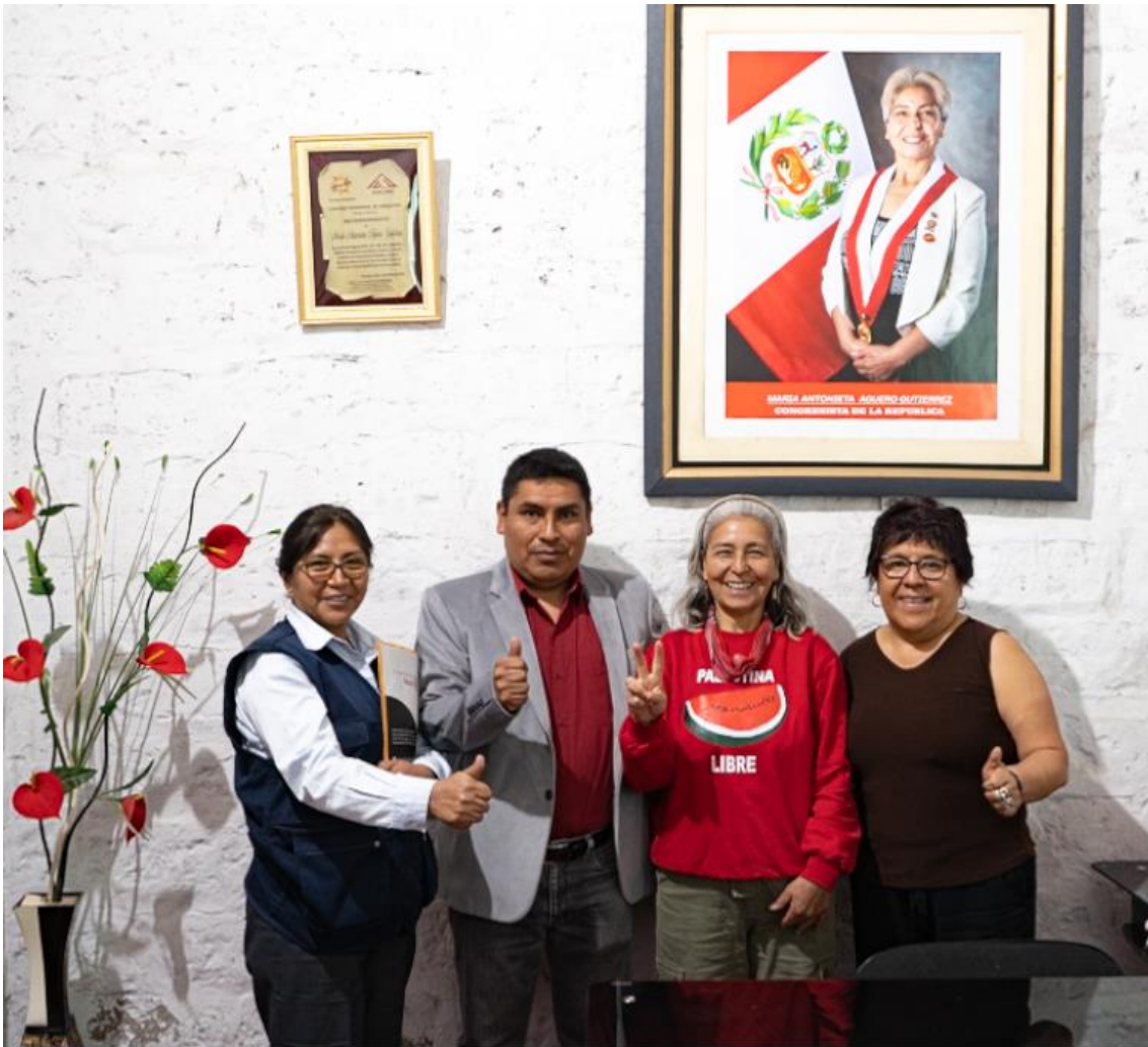
Figura 2. Mesa de Trabajo Multipartidario de Congresistas de la Región de Arequipa