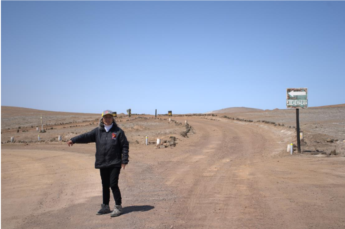
Figura 1. Visita a campo de las Vías Vecinales Carretera AR-834 y AR-835