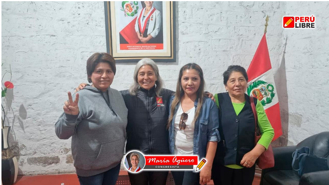
Figura 7. Reunión con el CAS ESSALUD