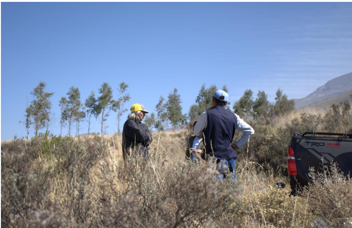
Figura 4. Visita al Cinturón Verde de Cayma