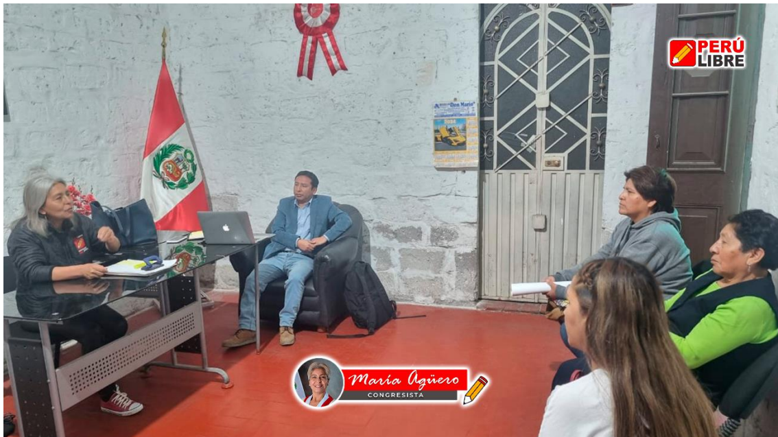
Figura 6. Reunión con el CAS ESSALUD