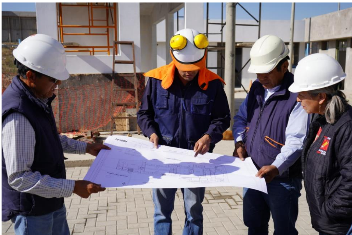
Figura 5. Inspección de la PTAR de Socabaya