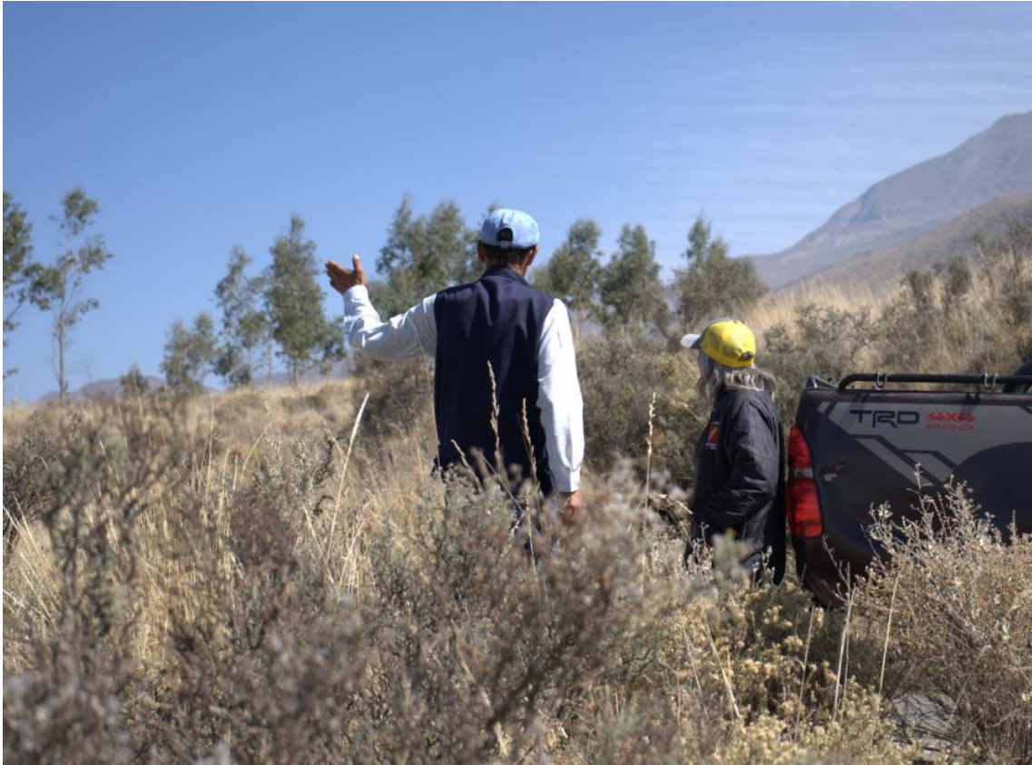
Figura 3. Visita al Cinturón Verde de Cayma