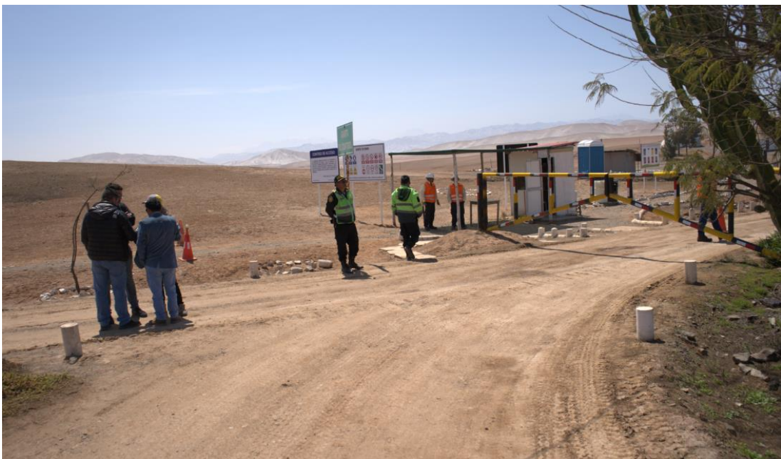
Figura 2. Visita a campo de las Vías Vecinales Carretera AR-834 y AR-835