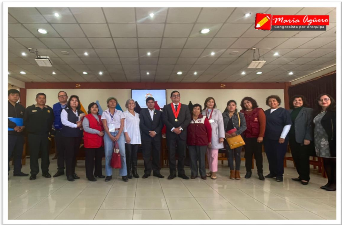
Imagen 2: Sesión ordinaria de la Instancia Regional de Concertación para la erradicación de la violencia contra las mujeres y los integrantes del grupo familiar.

El día martes 30 de mayo de 2023, participé en la sesión ordinaria de la Instancia Regional de Concertación para la erradicación de la violencia contra las mujeres, contándose con la participación del Gobernador Regional de Arequipa, el Gerente de la Gerencia Regional de Salud, el Presidente de la Corte Superior de Justicia de Arequipa, el Presidente de la Junta de Fiscales Superiores de Arequipa, el Jefe de la Oficina de la Defensoría del Pueblo – sede Arequipa y representantes de la sociedad civil organizada.