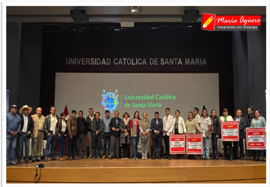
Imagen 5: Exposición de la problemática de los ciudadanos y emprendedores de Arequipa,

El día jueves, participé del conversatorio: "Problemática de los ciudadanos y emprendedores de Arequipa", en la Universidad Católica Santa María; entre los temas expuestos: