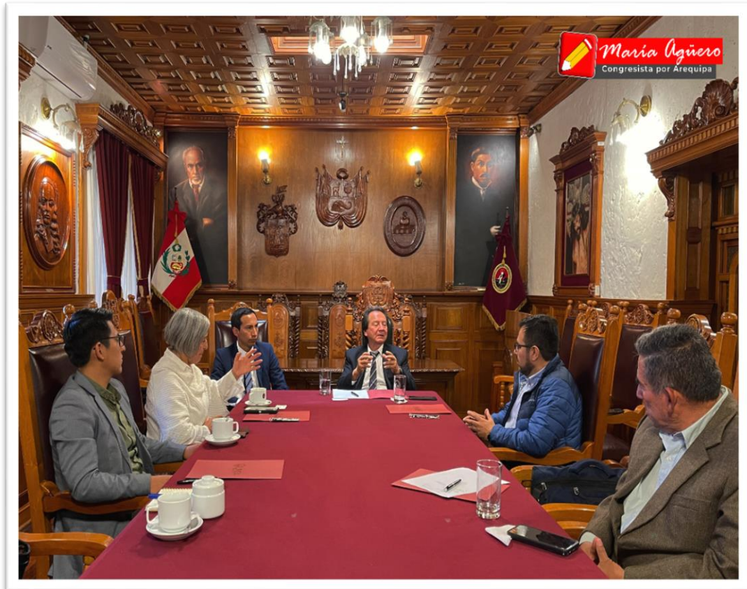
Imagen 6: Reunión con funcionarios de la UNSA sobre la implementación del Plan BIM.

En el último día de la semana de representación, sostuve un encuentro, junto con mi colega Carlos Javier Zeballos Madariaga, con el vicerrector de la UNSA y el Decano de la Facultad de Ingeniería Civil, para tratar la implementación del Plan BIM (Building Information Modeling) en las universidades y la gestión del presupuesto para implementarlo.