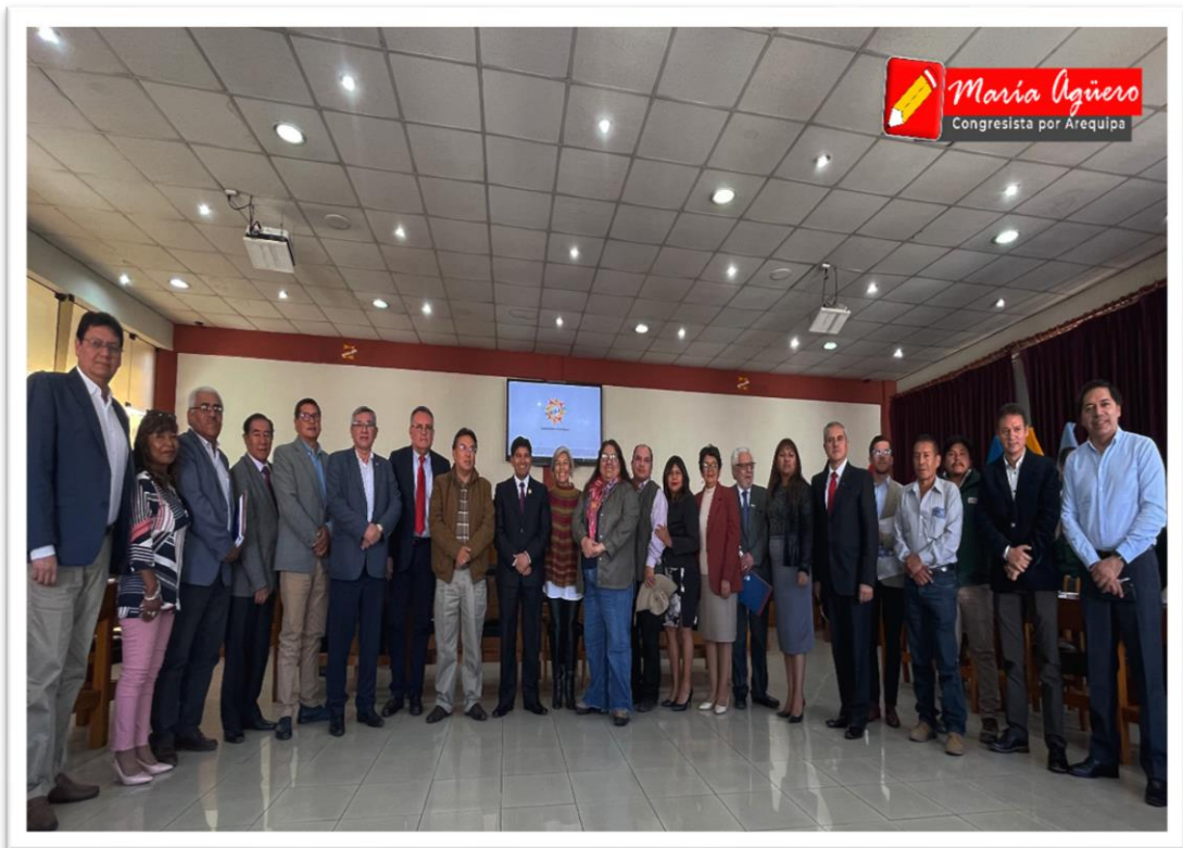
Imagen 4: Sesión del Consejo Directivo de la Agencia Regional del Desarrollo de Arequipa.

Asimismo, asistí a la sesión de reporte de daños, elaborado por el CENTRO DE OPERACIONES ESPECIALES DE LA REGIÓN AREQUIPA, en virtud del simulacro de sismo y tsunami, contándose con la participación del gobernador regional de Arequipa, el gerente general, gerente de salud, gerente de infraestructura, jefe de la región policial, jefe del cuerpo de bomberos de Arequipa, entre otros.