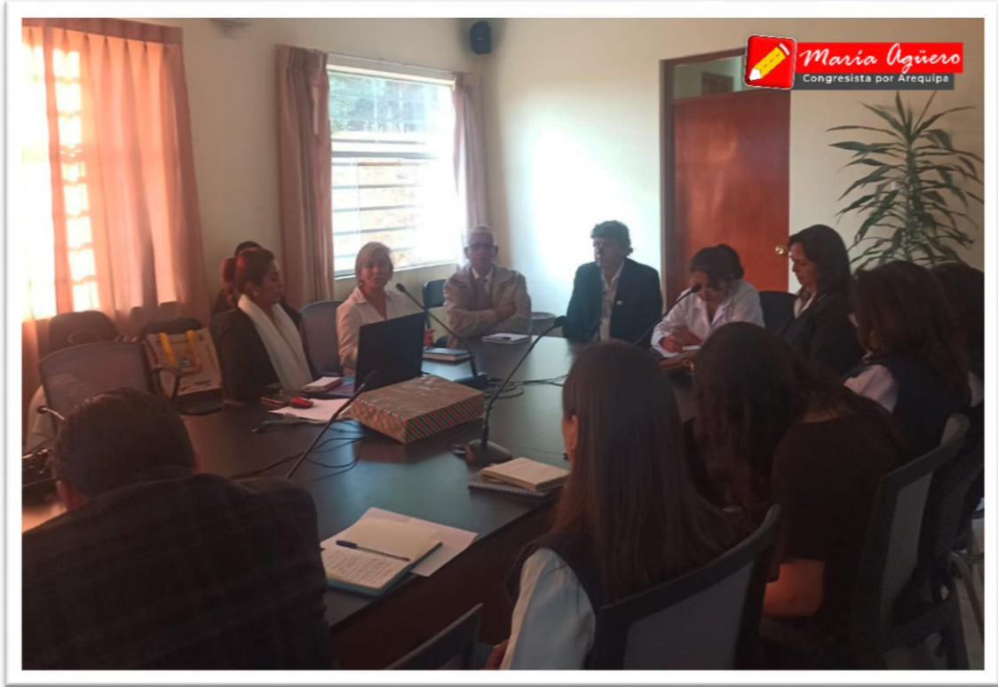
Imagen 3: Reunión con el Gerente General del GORE Arequipa,

En este día, me reuní con el Gerente General del Gobierno Regional de Arequipa, en la que expuso la problemática del sector turismo, que ha sido uno de los más golpeados económicamente y que es necesario desarrollar una estrategia, para promover el turismo en la región, señaló que, existen posibilidades de que el Ministerio de Economía financie una reactivación económica y así repotenciar lugares turísticos como Cotahuasi, así también, indicó que, elaboraran un plan de trabajo para brindar asistencia técnica a los distritos, ya que se ha observado que tienen expedientes técnicos muy mal elaborados y proyectos de inversión mal ejecutados, por ejemplo el hospital de Chala, en la que no tiene abastecimiento de agua, de igual manera existen obras que no se han avanzado casi nada, que están paralizadas, ya que avanzan 1% de la ejecución por año.