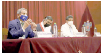
● AUTORIDADES DE ESSALUD se comprometen a la ejecución de obras.

Igualmente una inversión de 8 millones de soles en obras de mejoramiento y ampliación de diversos servicios de salud en el hospital Edmundo Escomei y en el centro médico La Joya, con el fin de fortalecer el primer nivel de atención.