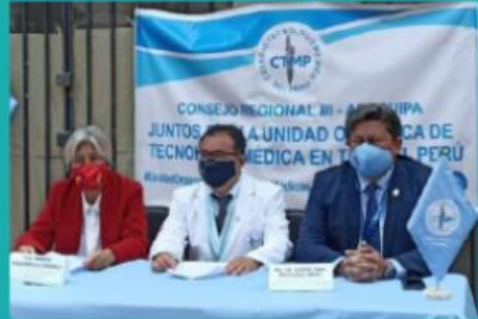
Acusan negligencias en profesionales.

también estaría ocurriendo ello. Indicó que es complicado denunciar, pues el año pasado se puso una denuncia penal, pero el supuesto profesional que era extranjero se fue durante el proceso. "Si se retiran ya nada se puede hacer con esta situación", dijo.