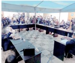
• CONSEJEROS REGIONALES autorizaron firmar la adenda 13 de Majes II.

Detalló que el cambio tecnológico propuesto en la adenda, es de más de 104 millones de dólares por concepto de Remuneración por Inversión Adicional (RIA), pero que lo que llegaría a cobrarse en