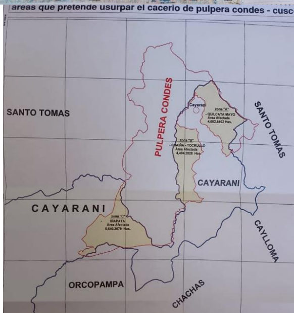
Mapa con las zonas afectadas

Asimismo, indican que están gestionando los siguientes proyectos;