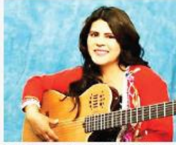
Geldres es amiga de Cáceres Lllica.