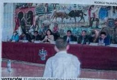
VOTACIÓN. El miércoles decidirán sobre vacancia.

De igual forma votará el congresista Alex Paredes González del Bloque Magisterial. En