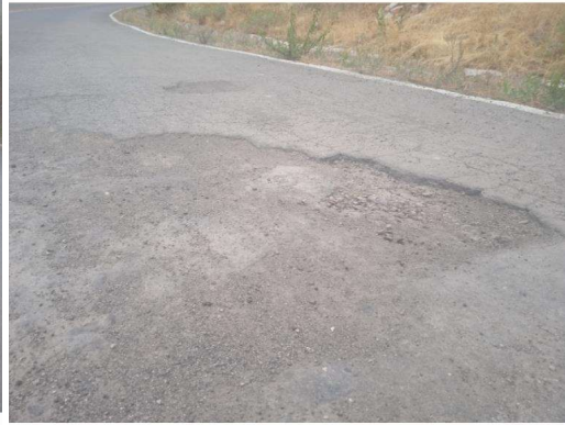
2 de 10