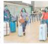
• NUEVAS MEDIDAS para el transporte aéreo.

Respecto a las principales acciones que deben efectuar los operadores aéreos y las aerolíneas, fijaron la colocación de merchas en el piso que identifiquen las posiciones de espera de los pasajeros en el terminal aéreo, mantener la adecuada ventilación en los terminales aéreos y desinfectar los ambientes de los aviones y terminales aéreas.