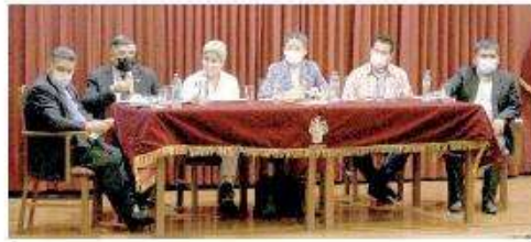
• CONGRESISTAS DE AREQUIPA se unen por Majes II.

Los congresistas arequipeños, insisten en la transferencia del proyecto Majes Siglas II al Ministerio de Agricultura, para ello sostendrán una serie de reuniones con entidades representativas para lograr su objetivo.