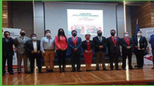
Parlamentarios están en semana de representación en la región.