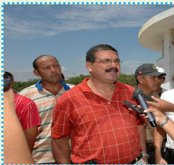
Cong. Carlos Cánepa, declarando a la prensa regional sobre los avances de la reunión en villa Puerto Pizarro