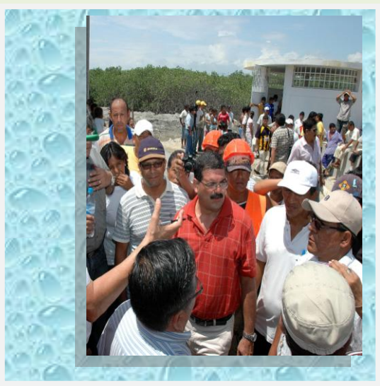
Mg. Ing. Carlos Cánepa La Cotera, Congresista de la República en Obra de Villa Puerto Pizarro