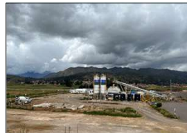
Fotografía N° 21: Vista de planta de Concreto sin actividad productivas.