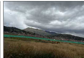
Fotografía N° 23: Vista de la zona de cerco tipo UNI faltante.