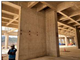
Fotografía N° 12: Vista de la zona de andaje de las estructuras metálicas del mezanine en el piso 1 del Procesador Central del Terminal de Pasajeros.