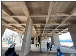
Fotografía N° 11: Vista del Bloque B del Dique Norte del Terminal de Pasajeros en donde no se viene efectuando ningún trabajo de campo durante la visita.