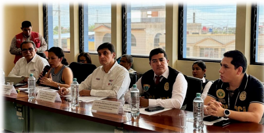
Vigésima cuarta sesión descentralizada celebrada Ucayali