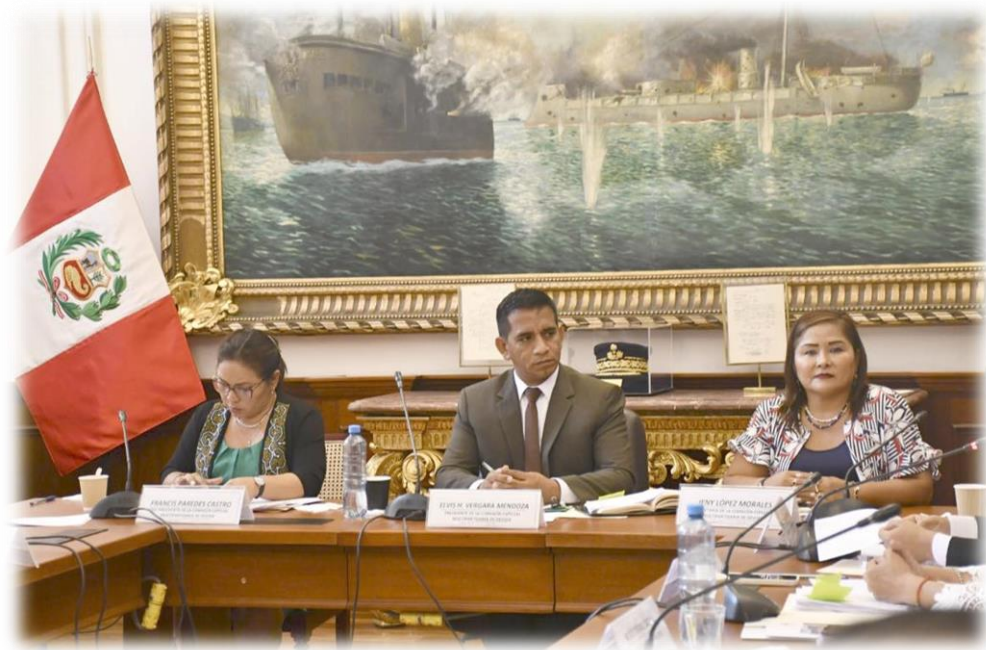
Sexta sesión extraordinaria