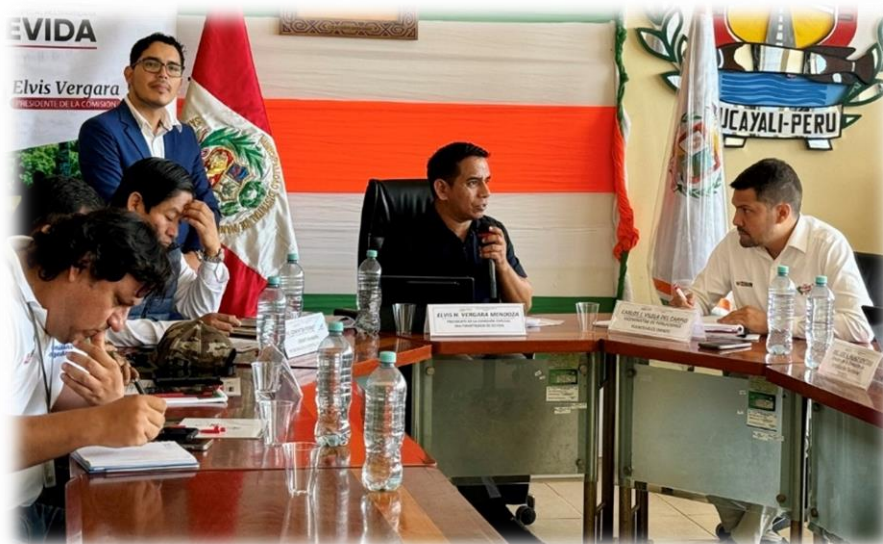
Vigésima cuarta sesión descentralizada celebrada Ucayali