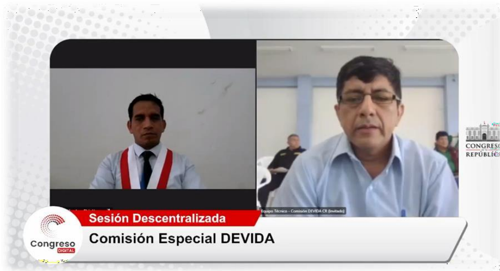
Sesión Extraordinaria Descentralizada en Aguaytía.