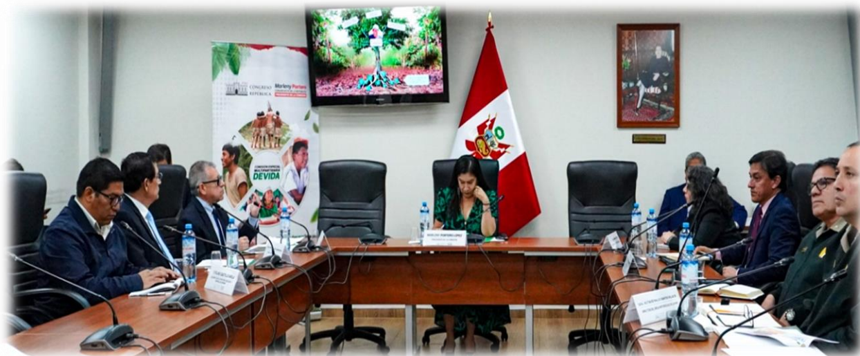
Séptima sesión ordinaria