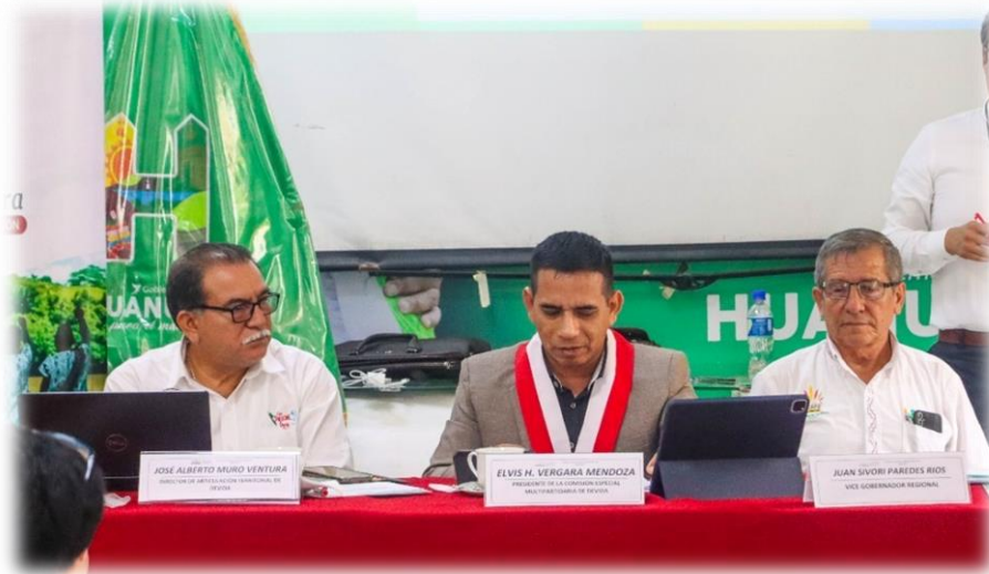
Décima novena sesión descentralizada Huánuco