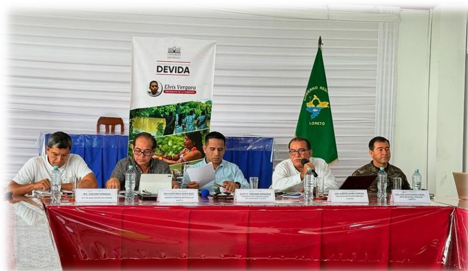
Vigésima tercera sesión descentralizada Loreto