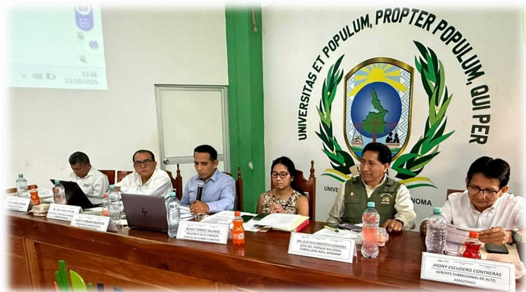
Segunda sesión conjunta descentralizada Loreto