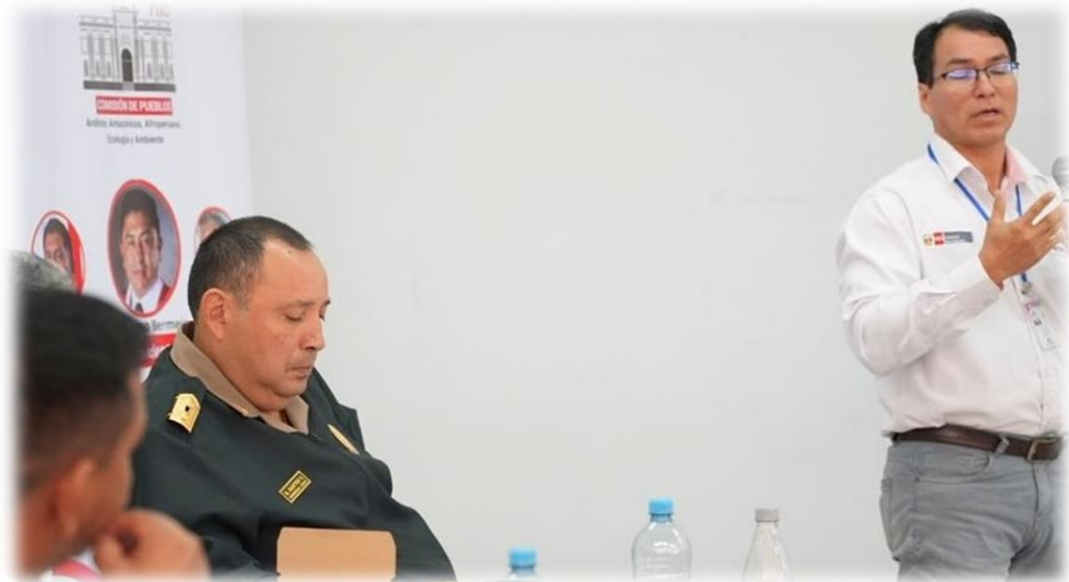
Primera sesión conjunta descentralizada Cusco