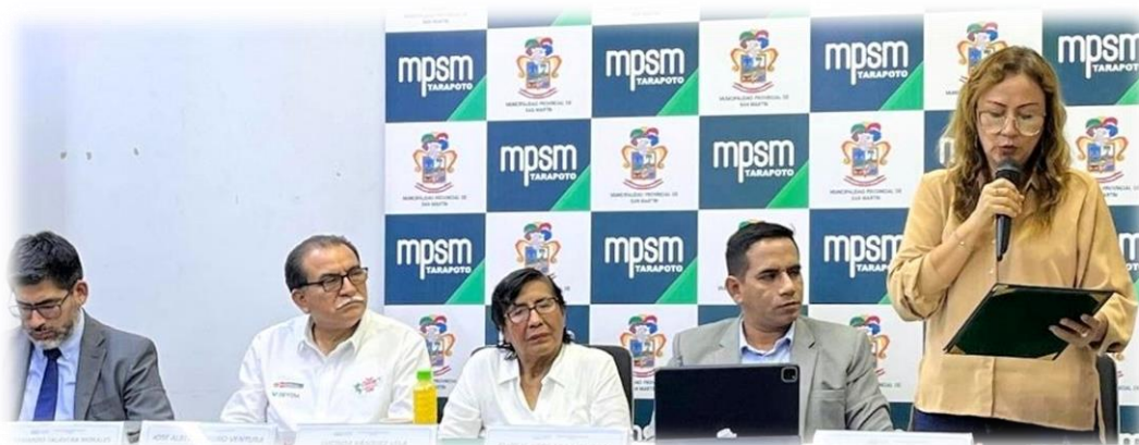
Vigésima sesión descentralizada Tarapoto – San Martín