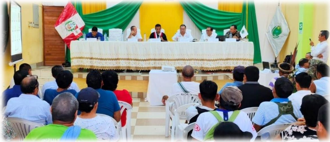
Vigésima primera sesión descentralizada Atalaya - Ucayali