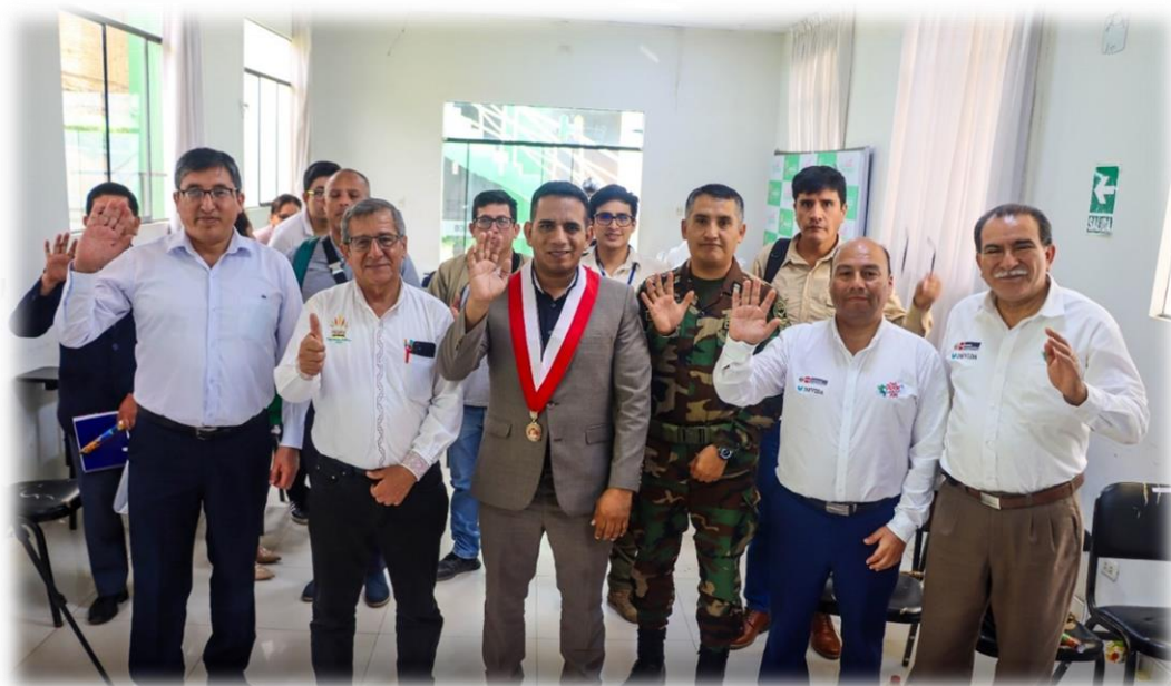
Décima novena sesión descentralizada Huánuco