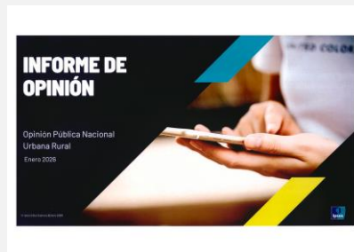
Informe de Opinión. (2026, enero). Ipsos Opinión y Mercado S.A.