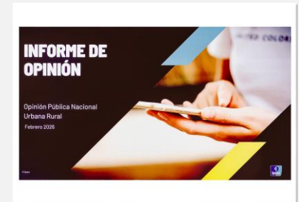
Informe de Opinión. (2026, febrero). Ipsos Opinión y Mercado S.A.