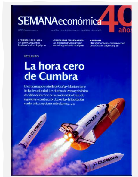
Semana Económica. (2026, marzo 15). Apoyo. N.º 2002.