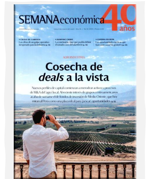
Semana Económica. (2026, marzo 8). Apoyo. N.º 2001.