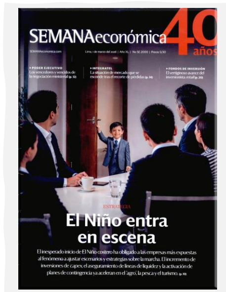
Semana Económica. (2026, marzo 1). Apoyo. N.º 2000.