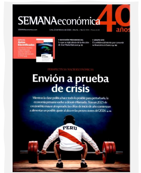
Semana Económica. (2026, febrero 22). Apoyo. N.º 1999.