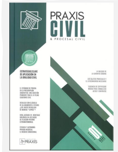
Praxis Civil & Procesal Civil. (2026, enero). Grupo Praxis Formación Profesional. N.º 01