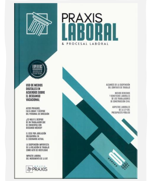
Praxis Laboral & Procesal Laboral. (2026, enero). Grupo Praxis Formación Profesional. N.º 01