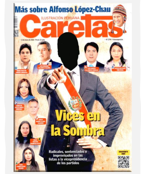
Caretas. (2026, marzo 12). N.º 2744.