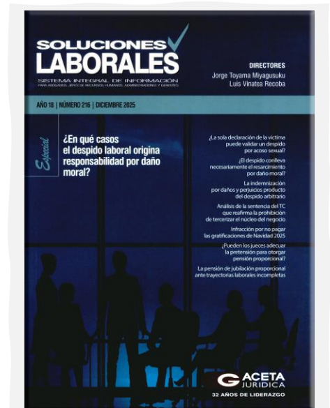
Soluciones Laborales. (2025, diciembre). Gaceta Jurídica. N.º 216.