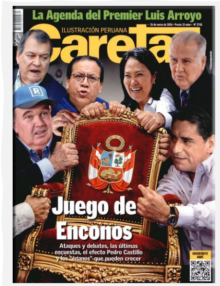
Caretas. (2026, marzo 26). N.º 2745.