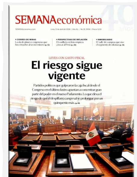
Semana Económica. (2026, abril 12). Apoyo. N.º 2006.