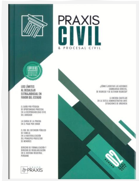
Praxis Civil & Procesal Civil. (2026, enero). Grupo Praxis Formación Profesional. N.º 02