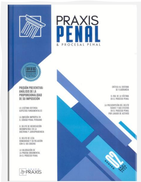
Praxis Penal & Procesal Penal. (2026, enero). Grupo Praxis Formación Profesional. N.º 02