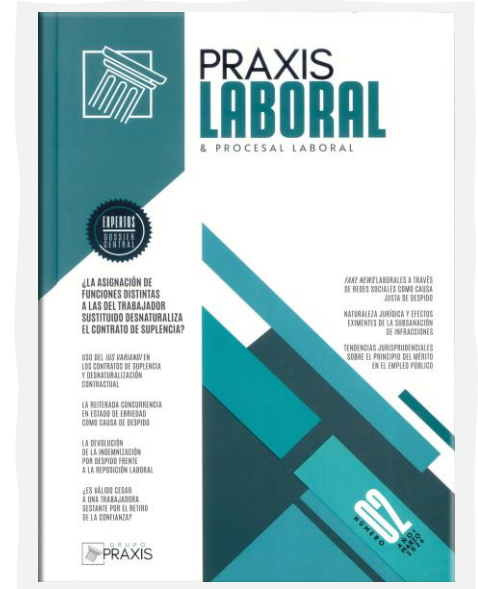
Praxis Laboral & Procesal Laboral. (2026, enero). Grupo Praxis Formación Profesional. N.º 02