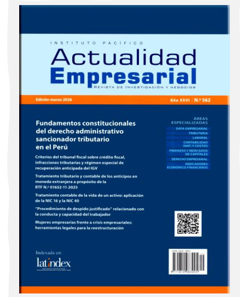
Actualidad Empresarial. Revista de Investigación y Negocios. (2026, marzo). Instituto Pacífico. N.º 562.