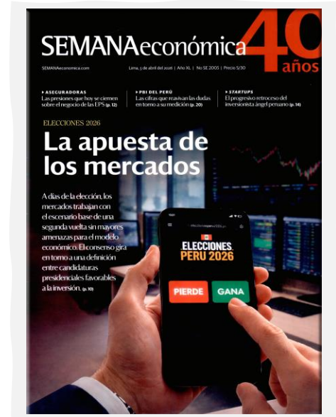
Semana Económica. (2026, abril 5). Apoyo. N.º 2005.