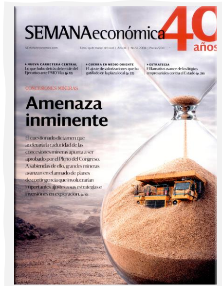
Semana Económica. (2026, marzo 29). Apoyo. N.º 2004.