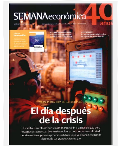
Semana Económica. (2026, marzo 22). Apoyo. N.º 2003.

Biblioteca del Congreso de la República César Vallejo