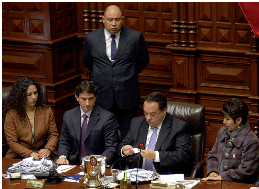
El Presidente del Congreso de la República, señor Luis Alva Castro, inicia el escrutinio.