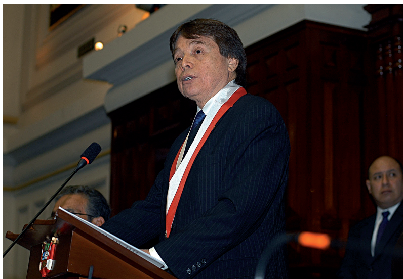
El congresista Cesar Zumaeta Flores pronuncia un discurso con motivo de su elección al cargo de Presidente del Congreso de la República.

este último año de mandato, teniendo como objetivo primordial el mejorar la imagen institucional de nuestro Parlamento, que ha sido mellada en los últimos años, lo que nos coloca en un serio problema de legitimidad ciudadana.