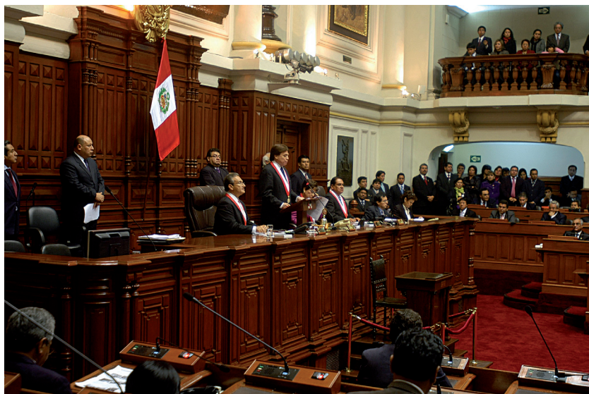
El congresista César Zumaeta Flores, finalizando su discurso con motivo de su elección como Presidente del Congreso de la República.

namiento de un sistema político o de un régimen político; es, más bien, un Estado moral, colectivo acerca de la calidad y deficiencia de nuestras instituciones y de nuestras representaciones sociales. La gobernabilidad es un estado que revela la forma en que uno puede ser capaz de preservar y consolidar la democracia como sistema de convivencia civilizada en el tiempo, fundamentalmente en este gran siglo que es el siglo XXI.