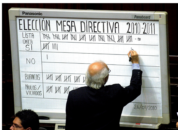
Un miembro del Servicio Parlamentario realiza las anotaciones de los votos en la pizarra.

—El señor Presidente efectúa el escrutinio.