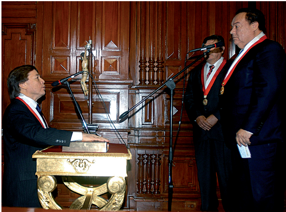
El congresista César Zumaeta Flores juramenta el cargo de Presidente del Congreso de la República.

Invito a subir al estrado al señor congresista Alejandro Aguinaga Rucenco, con la finalidad de prestar el juramento de ley para asumir el cargo de Primer Vicepresidente del Congreso de la República durante el Período Anual de Sesiones 2010-2011.