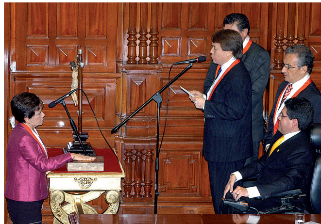
La congresista Alda Lazo Ríos de Hornung presta el juramento de ley para el cargo de Segunda Vicepresidenta del Congreso de la República.

—La señora congresista Alda Lazo Ríos de Hornung sube al estrado para juramentar