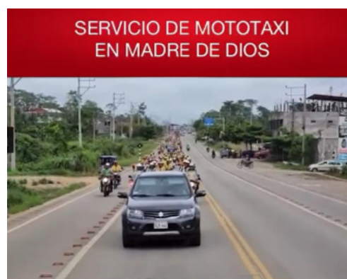
Comisión de Transportes y Comunicaciones

Aquí tenemos a toda la familia mototaxista en pie de lucha reclamando sus justos derechos.